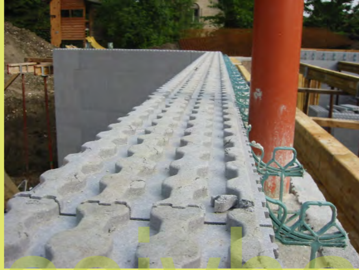
44_Kanalrohr im Betonkern