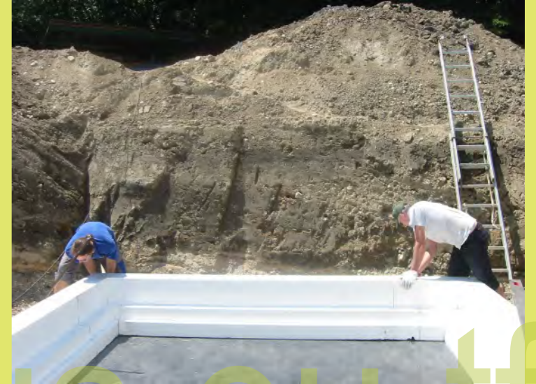
09_Einfach zusammen stecken