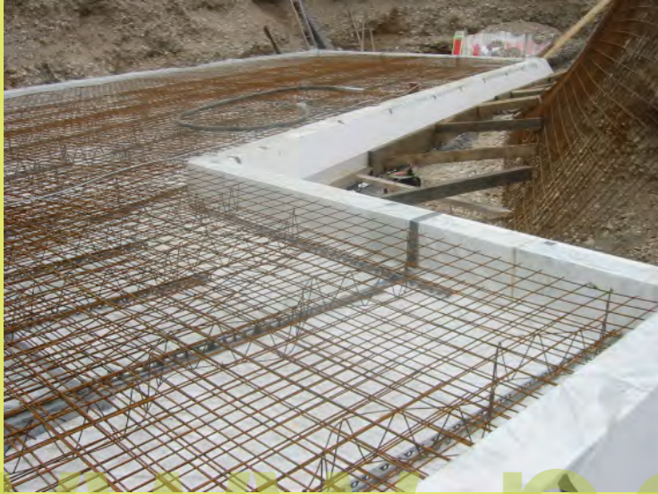
13_Bewehren mit Baustahl