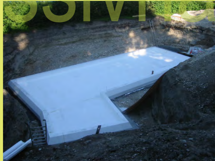
11_Fertig in 2 Tagen