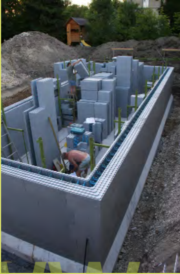
25_Die Richtstützen werden montiert