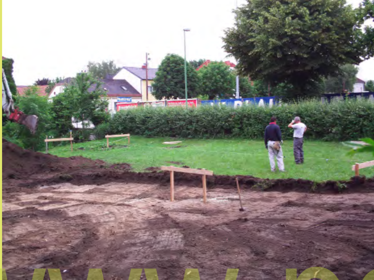
01_Mission is started