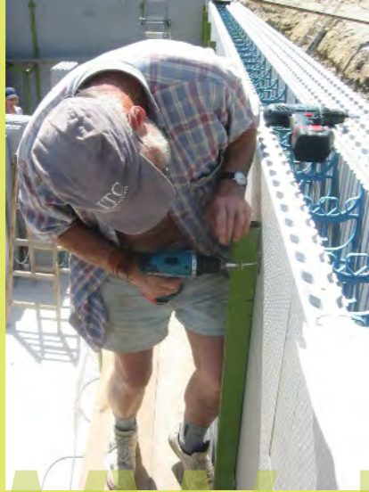
31_Anschrauben der Richtstützen