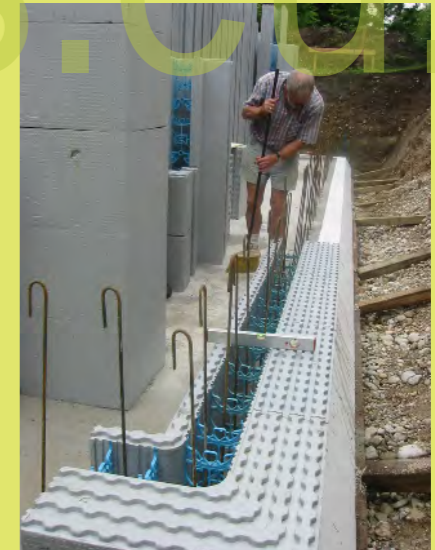
18_Robin unser WTM Systemberater