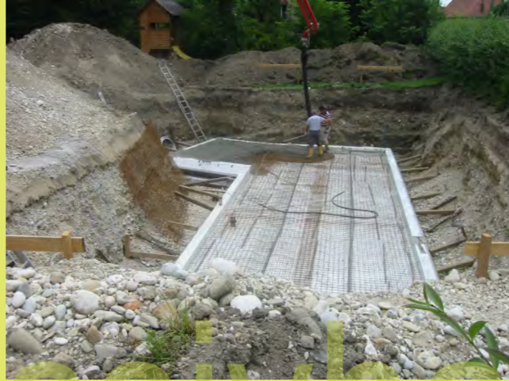
14_Der erste Beton fließt