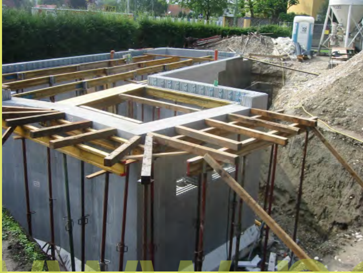
43_Hier wird ausgekragt