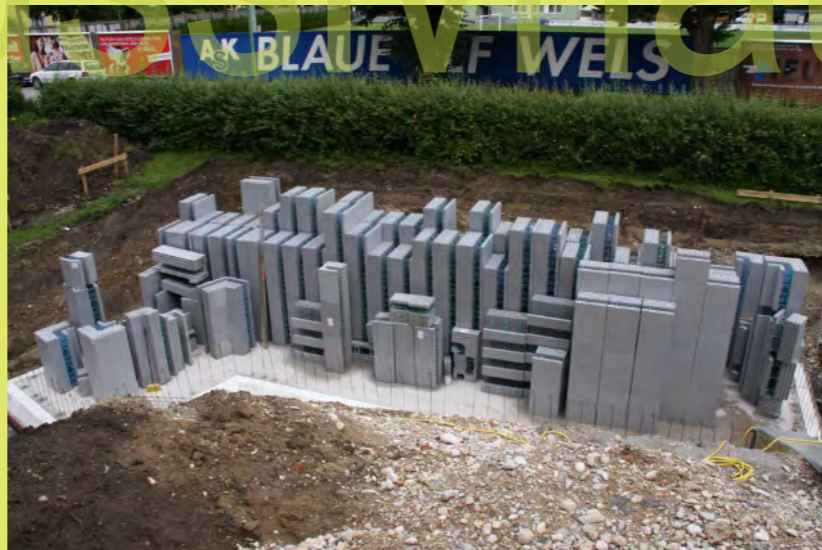
17_Die WTM-Steine sind da