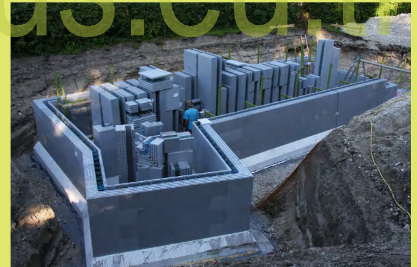
24_Jetzt wirds eng