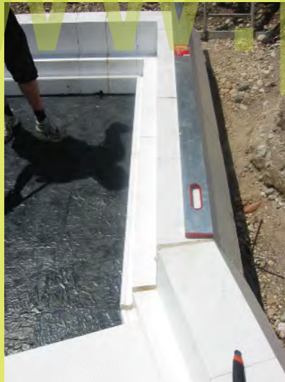
10_Sitzt, passt, und