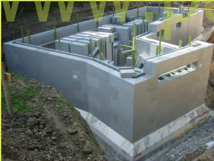
28_Die ersten Fensterstürze