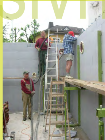
35_Beton aus dem Silo