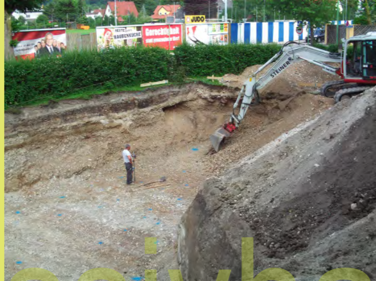
02_Ein riesen Loch