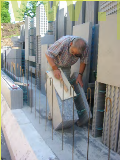
22_Feinheiten mit dem Hobelbrett