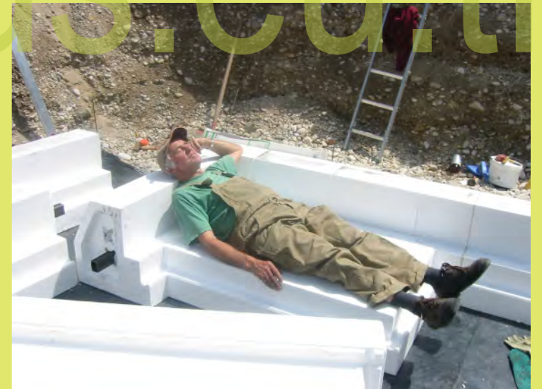
06_Das gewohnte Schläfchen