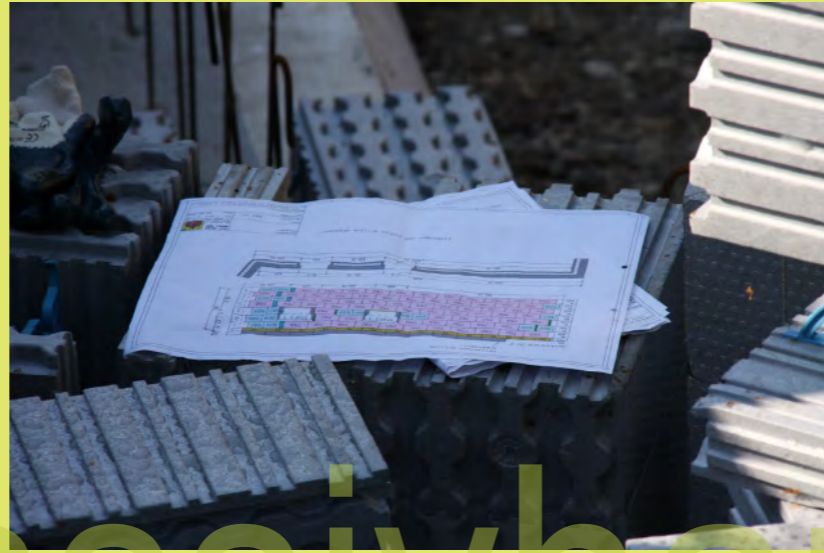
20_Der WTM Verlegeplan