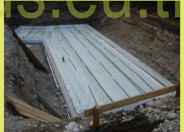
12_PE Folie und Drunterleisten