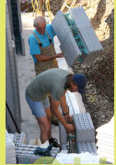
21_Wir lieben LEGO spielen