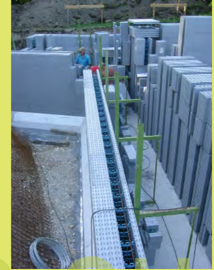
27_Und weiter stecken