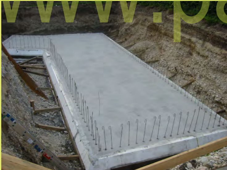
16_Steckeisen für den Betonkern