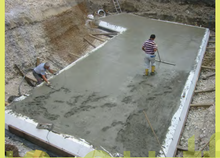
15_Mit der Kartäsche glätten