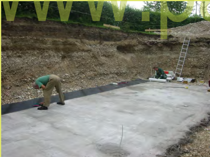
04_Abdichten der Bodenplatte