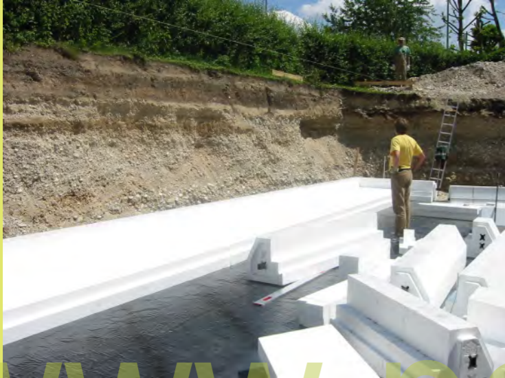
07_Iatzt is grad