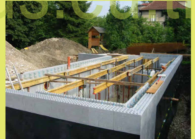
42_Die Decke kann kommen