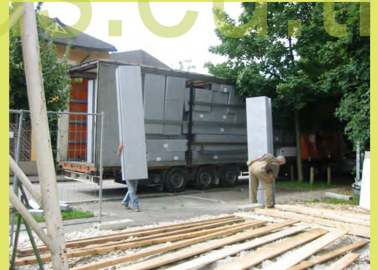
36_Neue Steine kommen