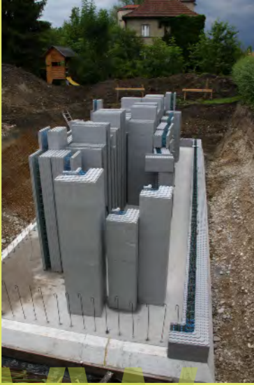
19_Die erste Reihe muss passen