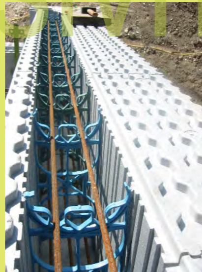
29_Eisen in die Ausnehmungen