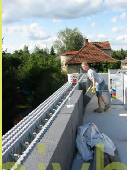
02_Ankleben der Attikadämmung