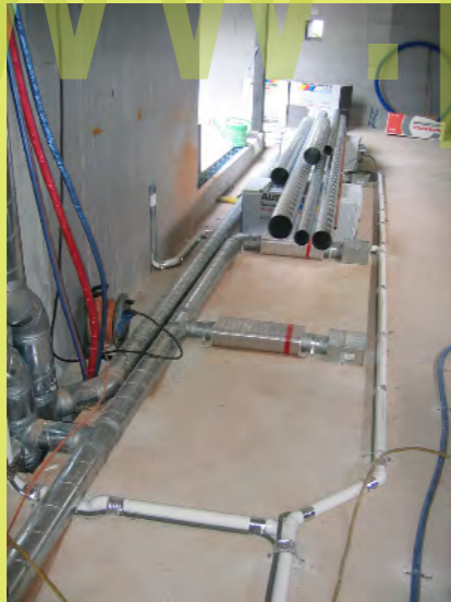
34_Die Lüftung und Staubsauganlage im EG