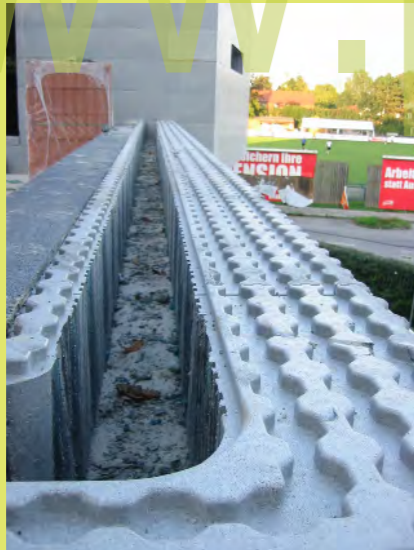
16_Aus dem oberen Attikastein wurden die Stege he...