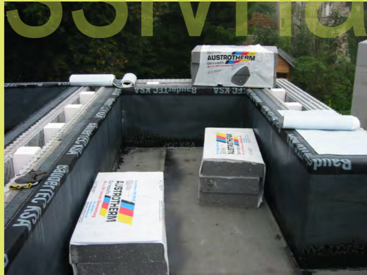
35_Die Dampfsperre am Dach wurde aufgebracht