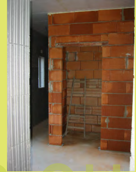
21_Eine bisher ungewohnte Farbe auf unserem Bau