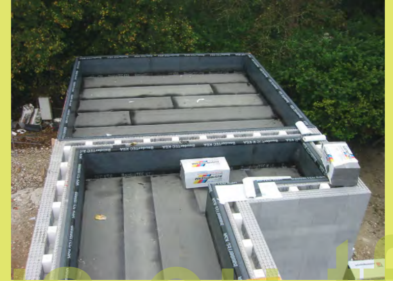
39_Auch das Garagendach wurde geflämmt und gekl...