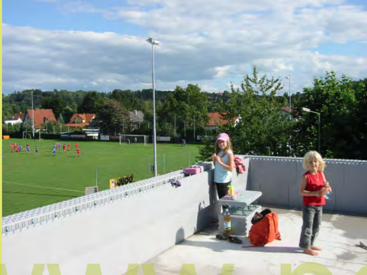
01_Gute Aussicht auf das Fussballspiel