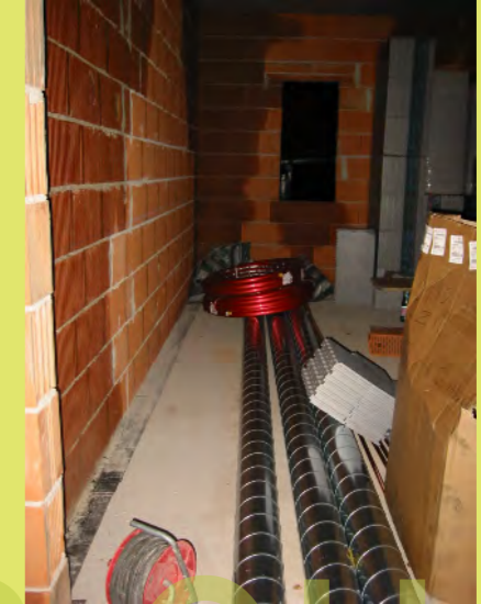
15_Dann ist auch schon der Installateur angerückt