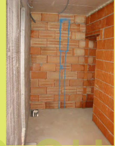
27_Die Steigleitung für die Lüftung