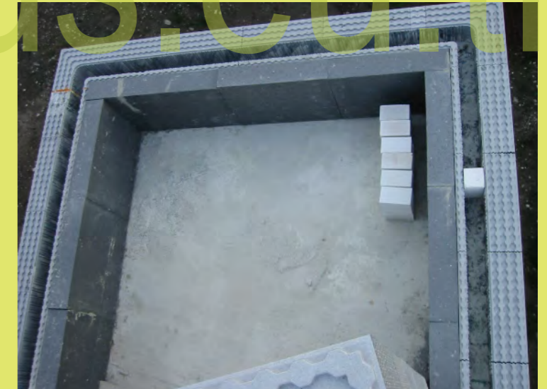
18_Dann mussten zirka 160 YTON Steine zugeschnit...