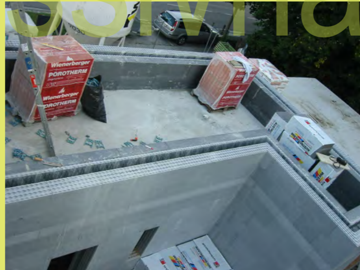
17_Das waren ganz schön viele