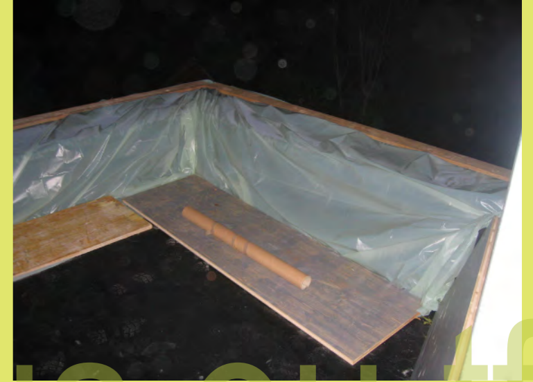
57_Die Attika wird mit Folie geschützt