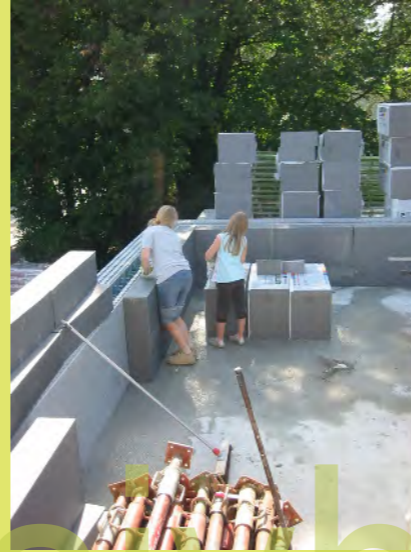
08_Auch die Attika der Terrasse wiles warm haben