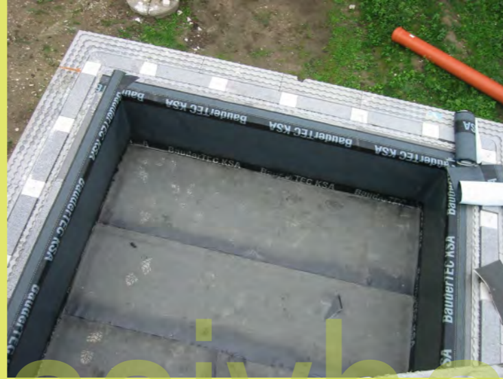
38_Dazwischen wird wieder gedämmt