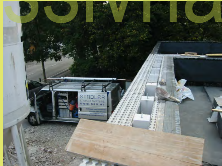
47_Ausdämmen der Attika