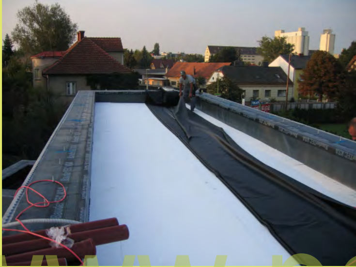
55_Nun die EPDM-Kautschukfolie