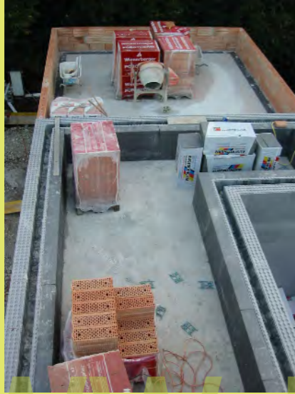
19_Die Garage bekam eine Ziegel Attika