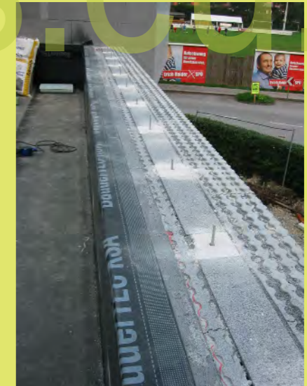
48_Die Attika YTONG Elemente auf Gefälle geschliffen