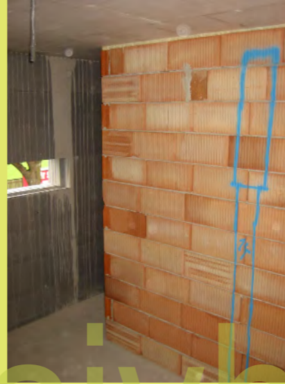
26_Die Stemarbeiten werden gekennzeichnet