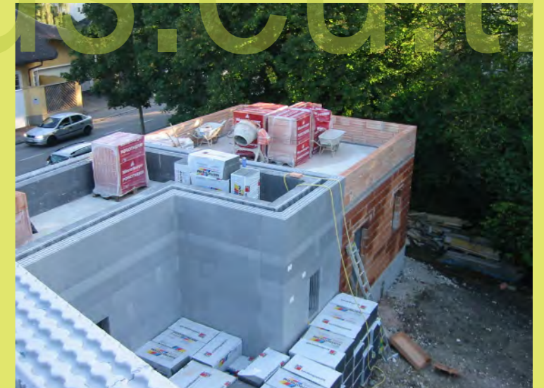
24_Dach und Lagerplatz in einem