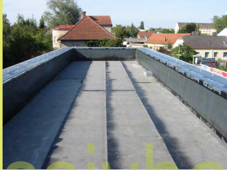
50_Bereit für die Dämmebene