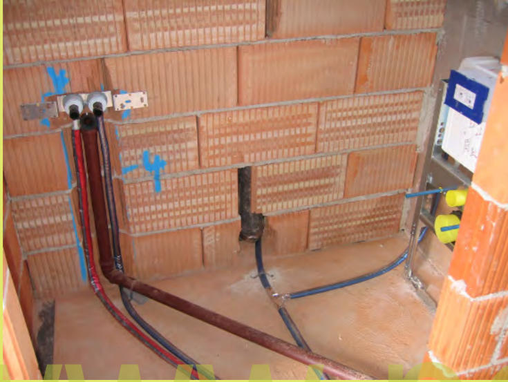
31_Viele Meter Rohr und Schlauch