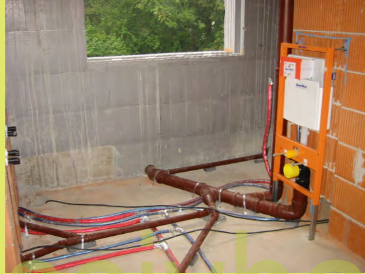
44_Auch der Spühlkasten sitzt schon