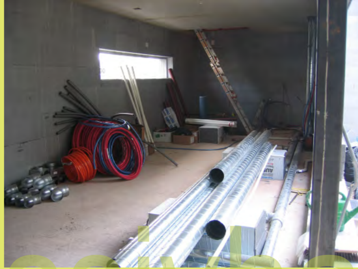
32_Das muss noch alles in den Boden und die Wände