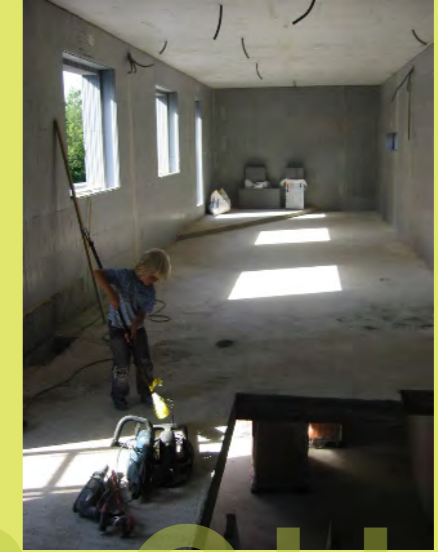
09_Elias kehrt das Obergeschoss