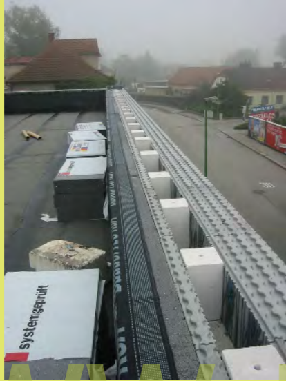
37_Die YTONG Einsätze