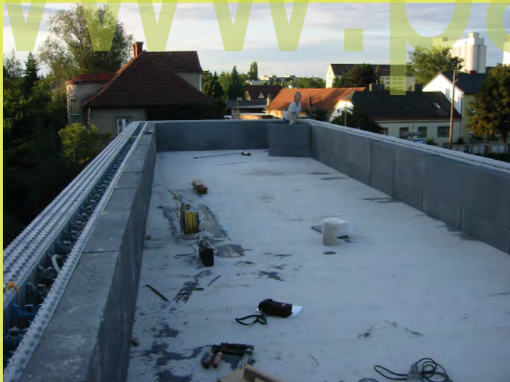
04_Jetzt ist die Attika warm eingepackt