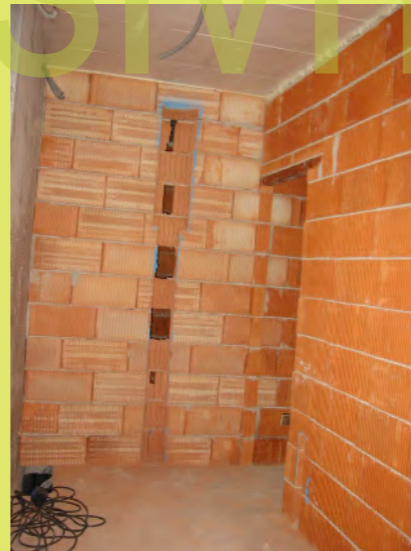
29_Beim Stemmen sind wir öfter durchgebrochen