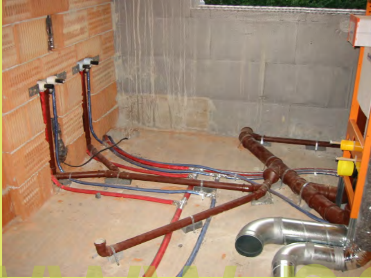
43_Leitungs Wirr-Warr im Bad