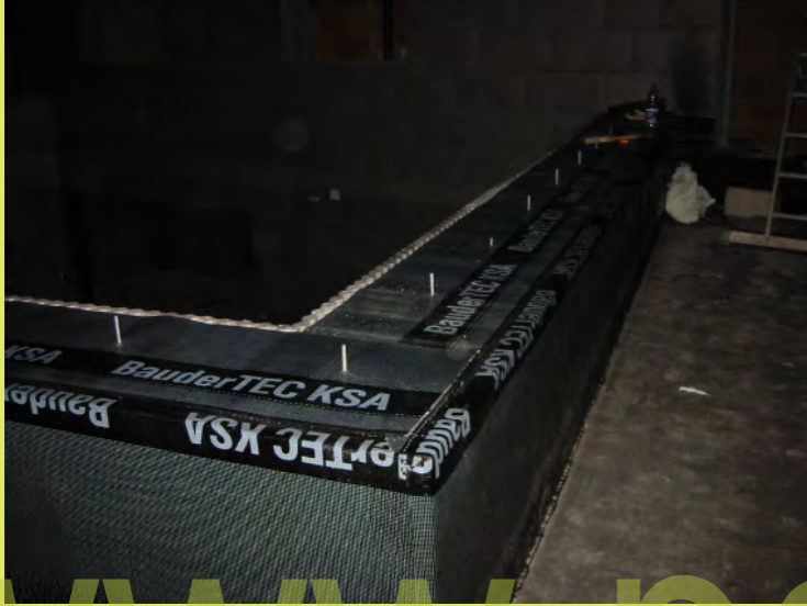
49_Auch die Attika-Oberseite erhält eine Dampfsper...