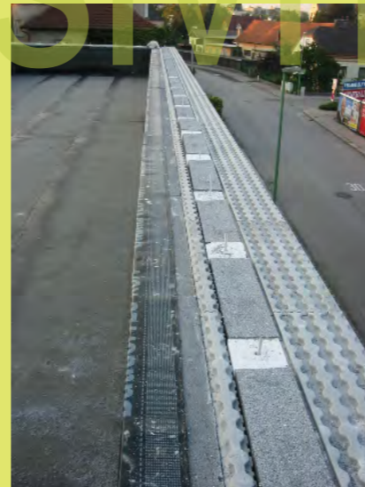
41_Die Gewindestangen für die Plattenbefestigung