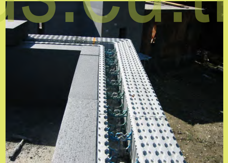
06_Ganz schön Dick mann