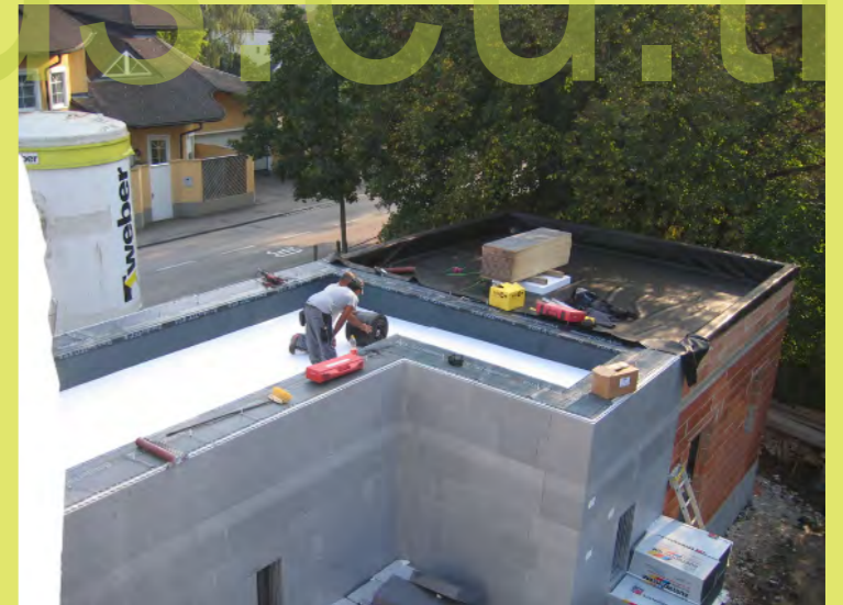
54_Auch die Terrassenflächen bekommen noch eine ...