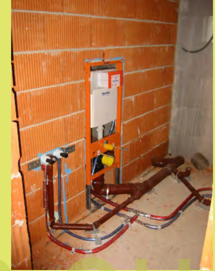
45_Im Keller ist der Spühlkasten Flächenbündig