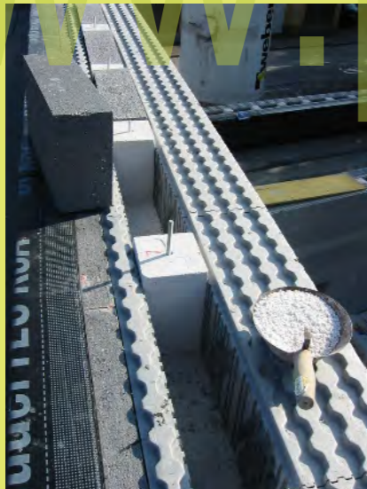
40_Unebenheiten wurden mit Schüttung ausgeglichen