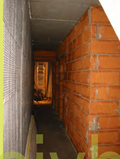
14_Die Innenwände wurden in 3 Tagen aufgemauert