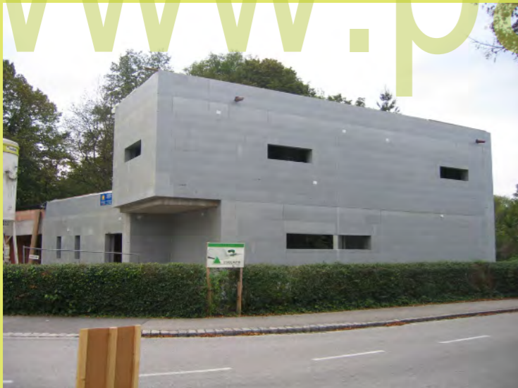
58_Nun hat unser Dach auch Abläufe