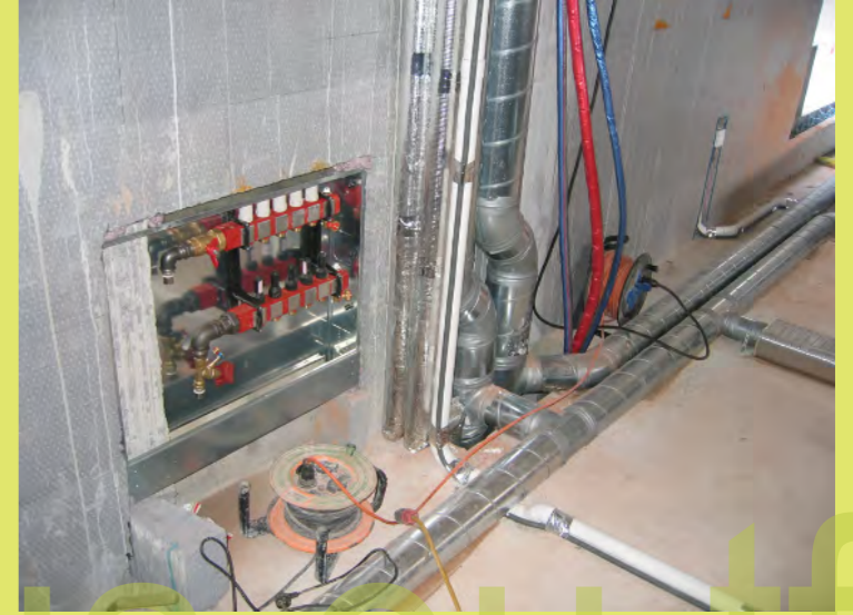
33_EG-Verteiler und ziemlich voller Steigschacht