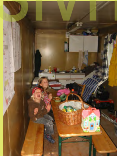
11_Die Kids gucken einen Film im Baucontainer