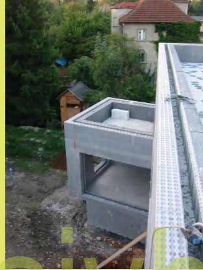
20_Die Schalung des großen Fensters wurde mittler...