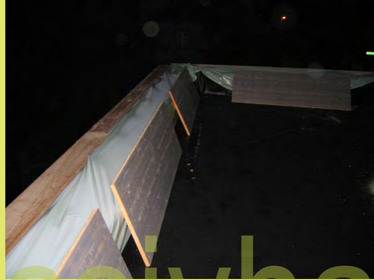
56_Die Attikaplatten dienen als Belastungsgewicht