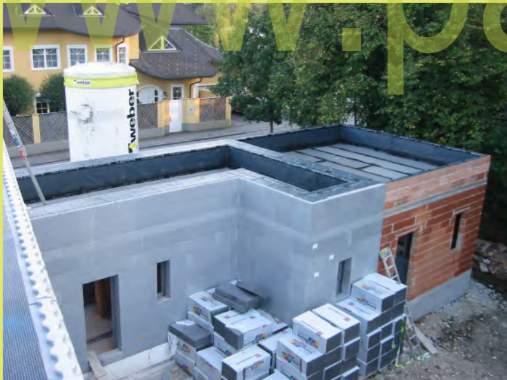
52_Die NG-Terrasse und das Garagendach