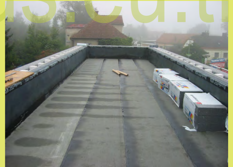
36_Auf der Decke gevlämmt und seitlich geklebt