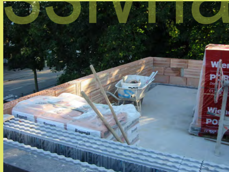
23_Attika der Garage