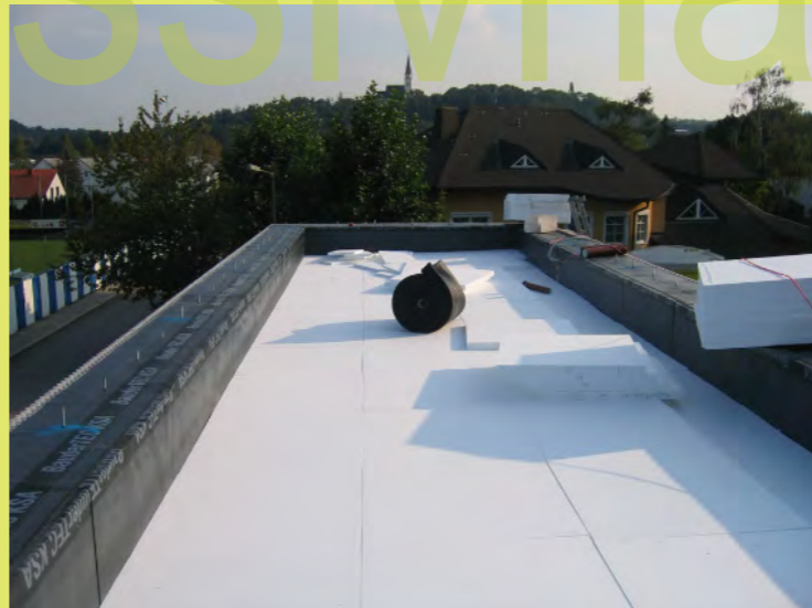
53_Noch einmal 30cm Dämmung