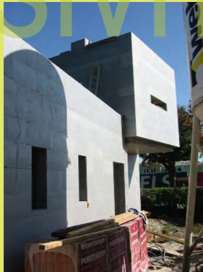
05_Jetzt schwebt die Auskragung ohne Unterstellung