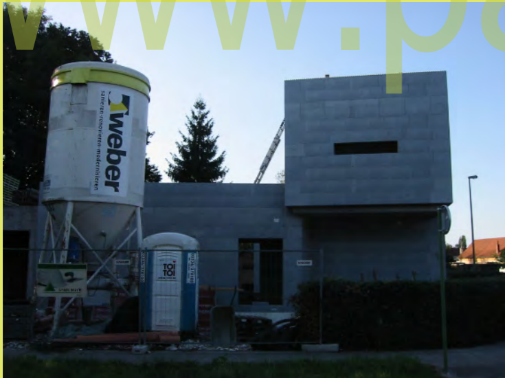
10_Abendstimmung auf der Baustelle