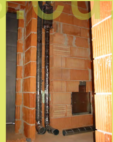
42_Die Steigleitungen für die Lüftung in den Zwisch...