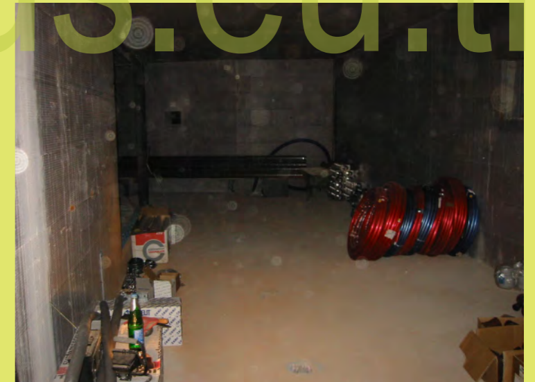
30_Die Installation beginnt