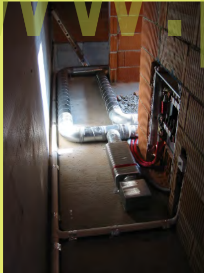
46_Lüftungsleitungen und Schalldämpfer am Boden