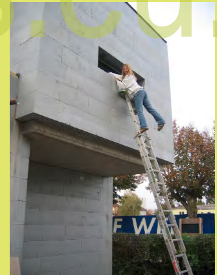
24_Pezi macht den Glatzstrich außen