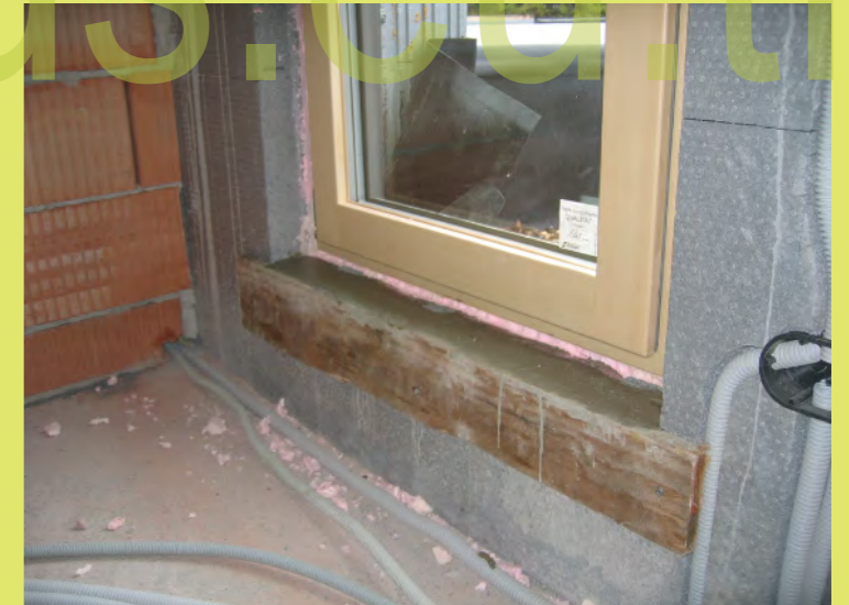
36_Das Mörtelbett für die Fensterbank