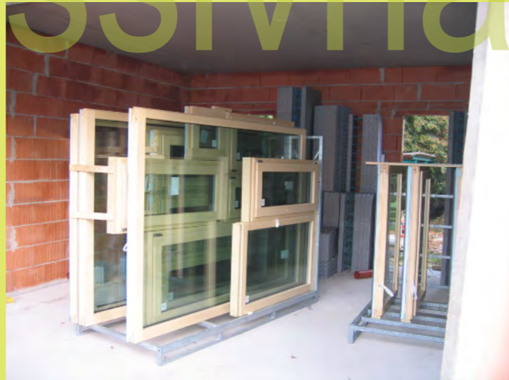
17_Die Fenster sind da