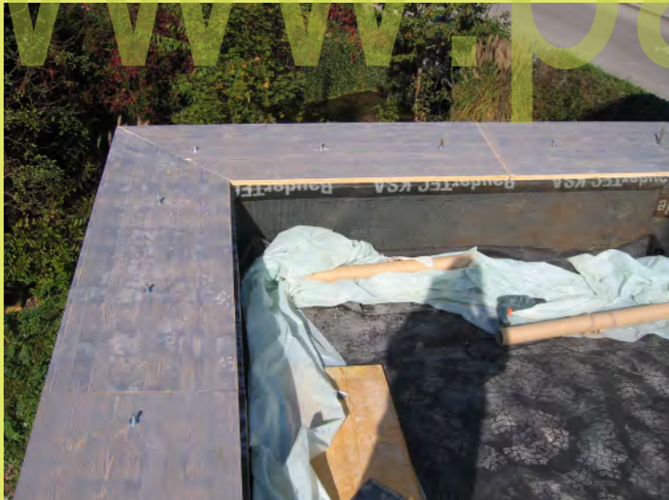
10_Die Abdeckung hat bereits Gefälle nach Innen