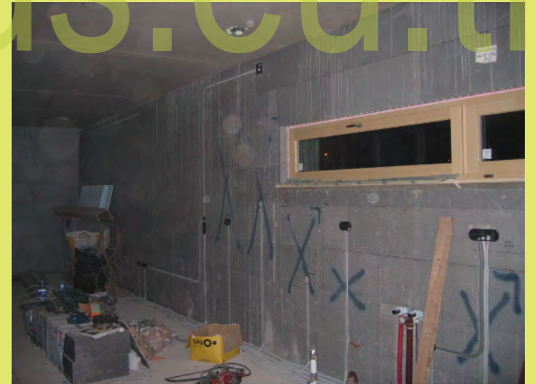
43_So viele Dosen