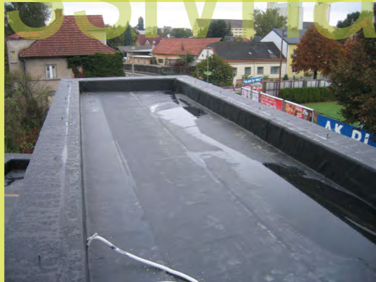
23_Jetzt ist der Regen schon egal