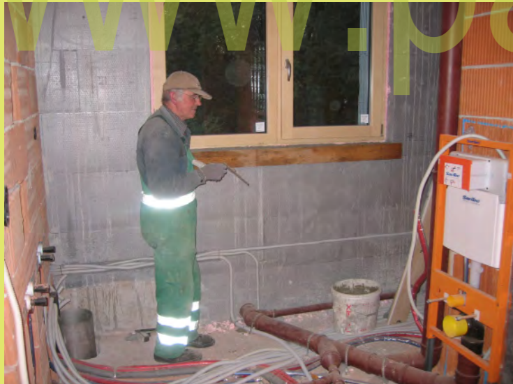
34_Pa montiert die Innenfensterbänke