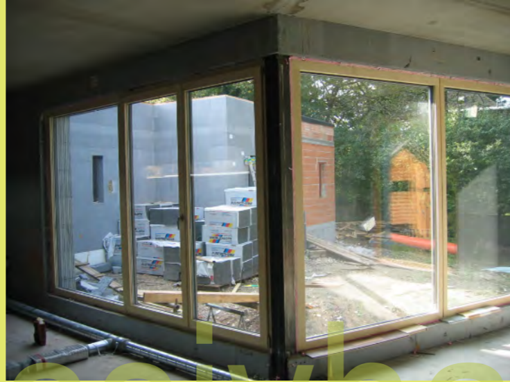
26_Endlich sind wir dicht