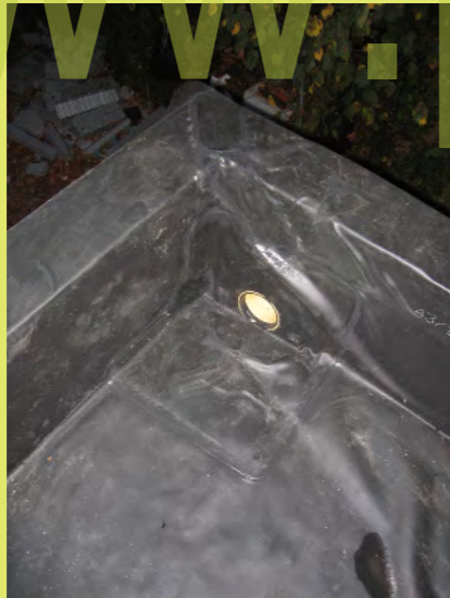
16_Der eingeschweißte Ablauf