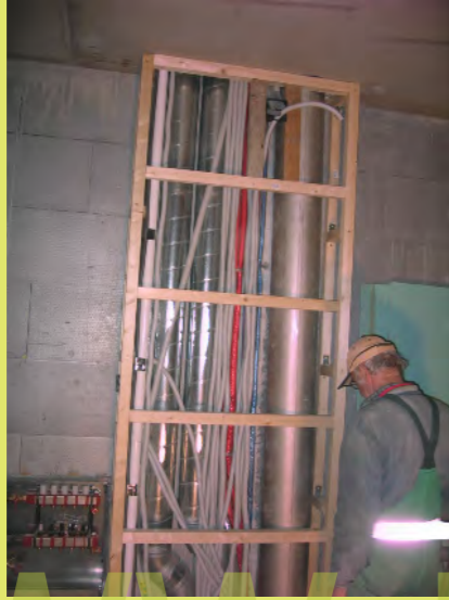
44_Der Versorgungsschacht wird eingepackt