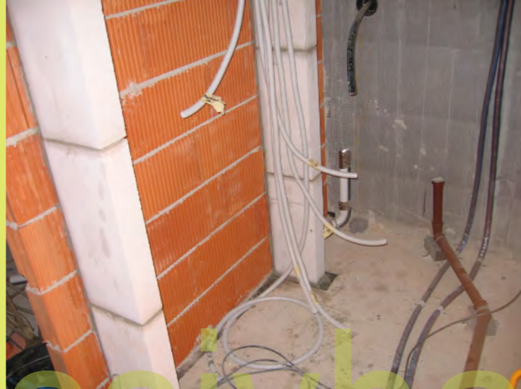
38_Die Verteilernische ist aufgemauert