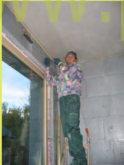
40_Kabelkanäle ganz easy mt der Säge