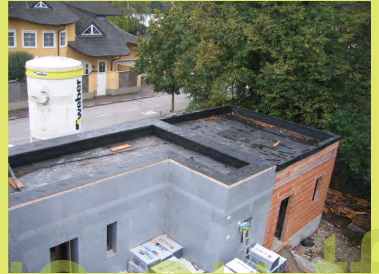
21_Die EPDM-Folie wird über die Attika gezogen