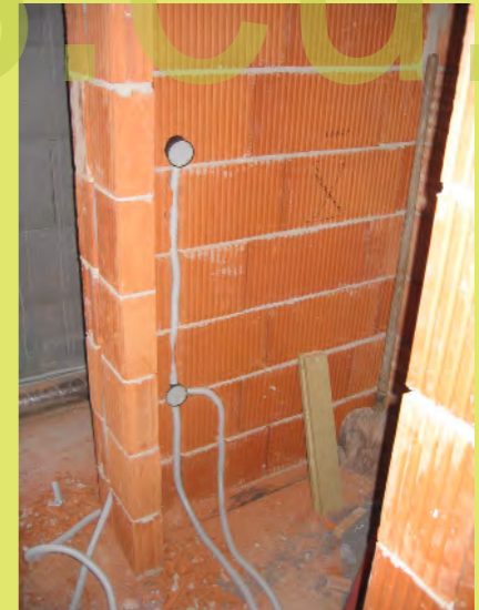
30_Im Ziegel muss gestemmt werden