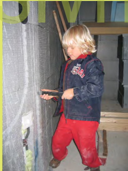
41_Sogar Elias hat es Spaß gemacht