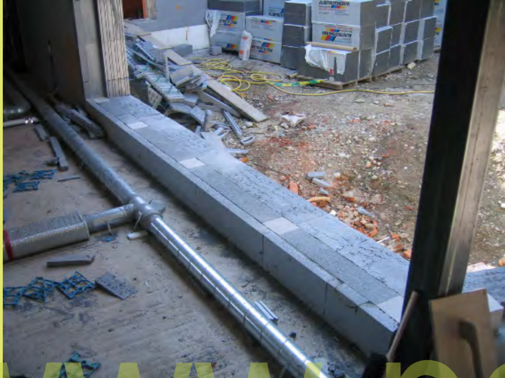
07_und anschliessend verschliffen