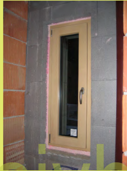
20_Die Fenster passen gut