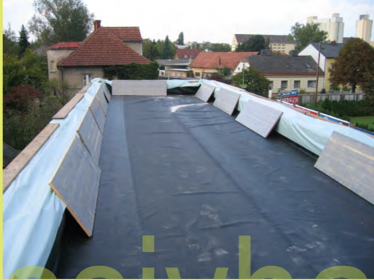
02_Falls der Regen kommt