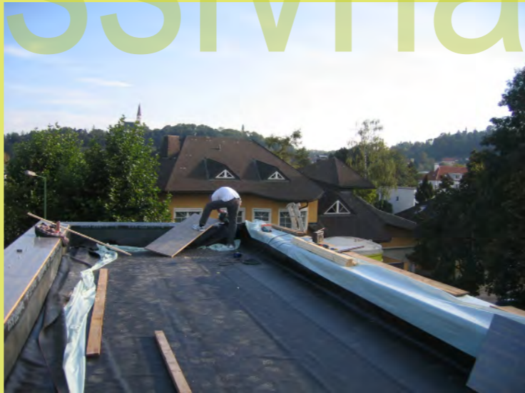
05_Montage der Arrika-Holzabdeckung