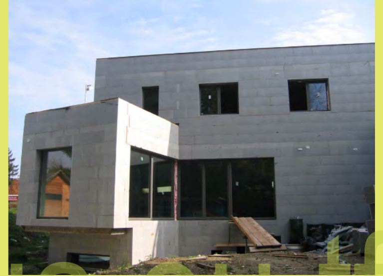
27_Sieht doch gleich viel besser aus