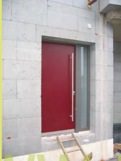
31_Nun ist auch die Haustür da