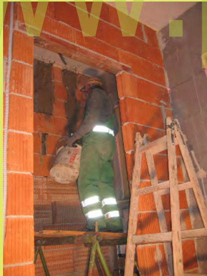
47_Eine ziemlich heftige Arbeit