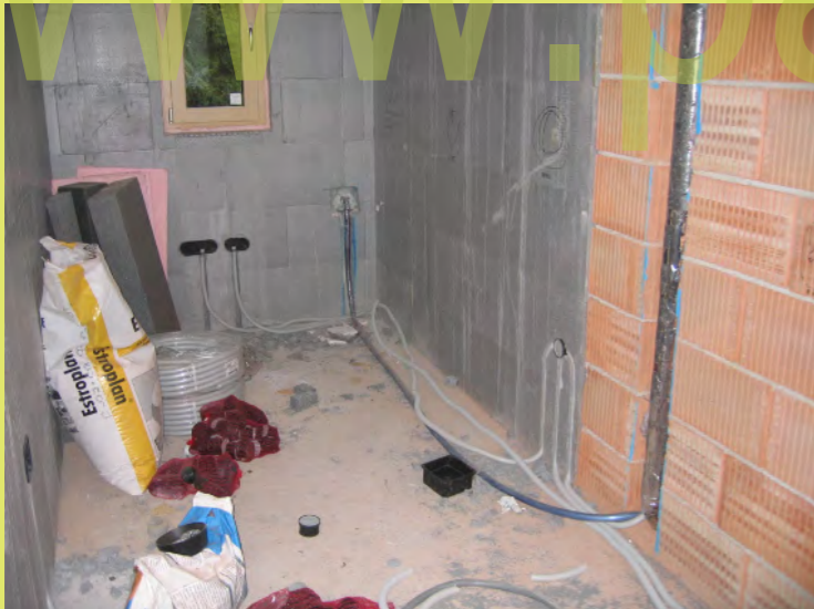
28>Weiter gehts mit der E-Installation