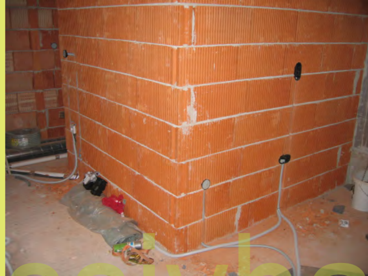
32_Kaum zu glauben wie viel da zu stemmen ist