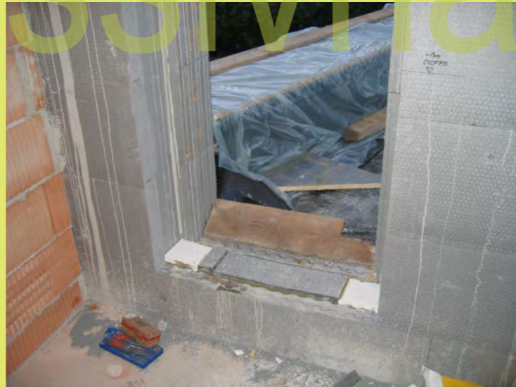
11_Die ausgedämmten Türaufleger