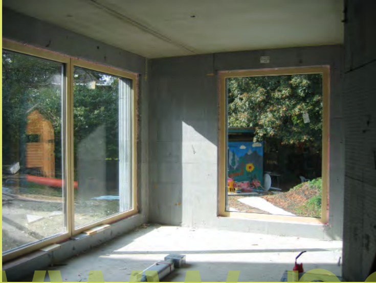
25_Zimmer mit Aussicht