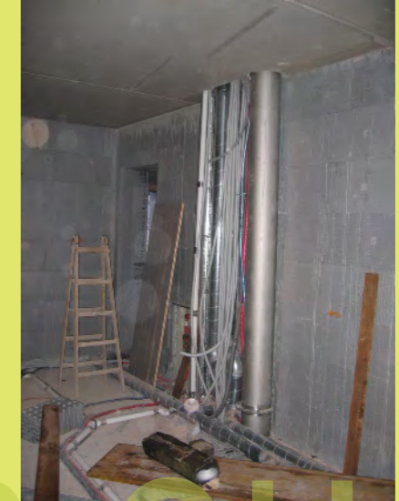
33_Der Schacht füllt sich - auch mit der Wäscheruts...