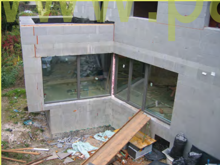
22_Auch die großen Fenster sind montiert