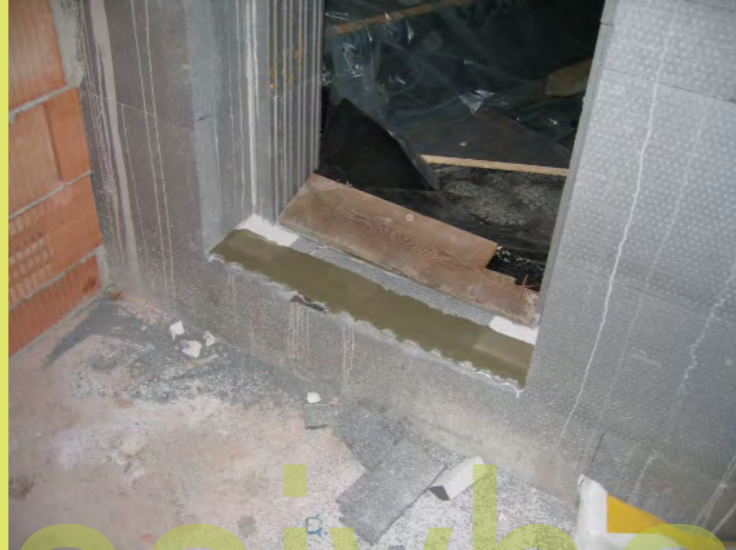
14_Der Glattnstrich bei der Gartentür