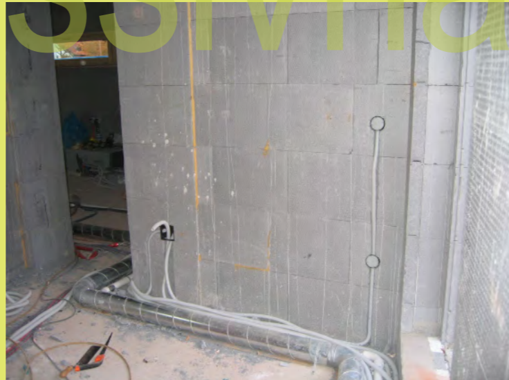
29_Am einfachsten ist die im WTM-Material