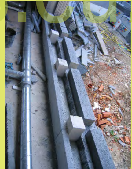
06_Die Fensterauflager werden gedämmt