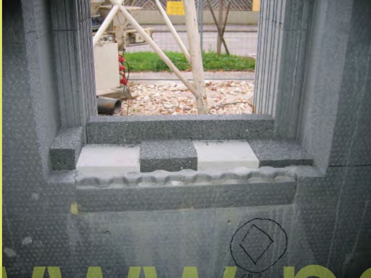
13_Warm eingepackte Fensterauflager