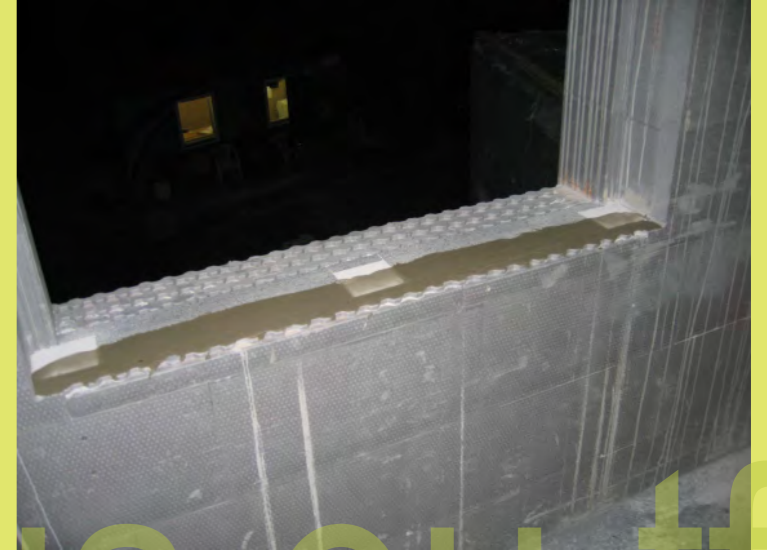
15_Das Fenster kann kommen