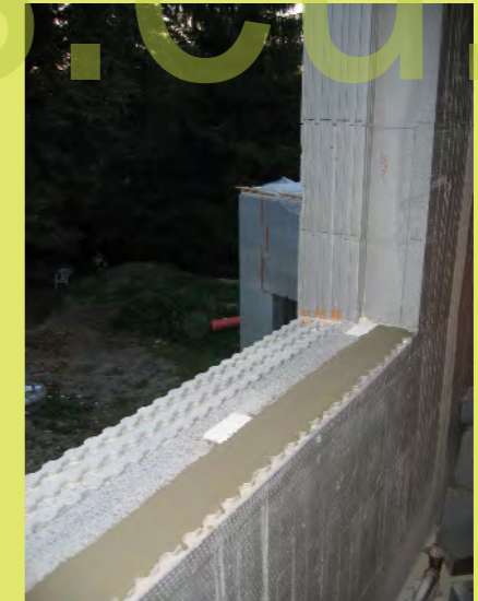
12_Ein Glattstrich aus Flex-Kleber für den Fensteran...