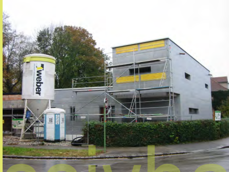
02_Die Unterkonstruktion für die Solarkollektoren