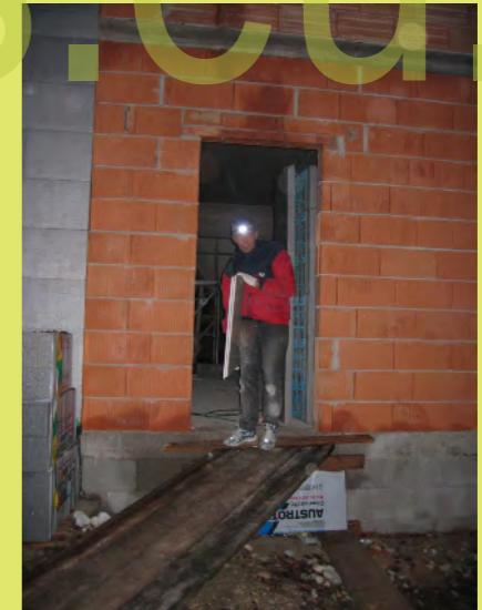
12_Gearbeitet wird bis spät in die Nacht