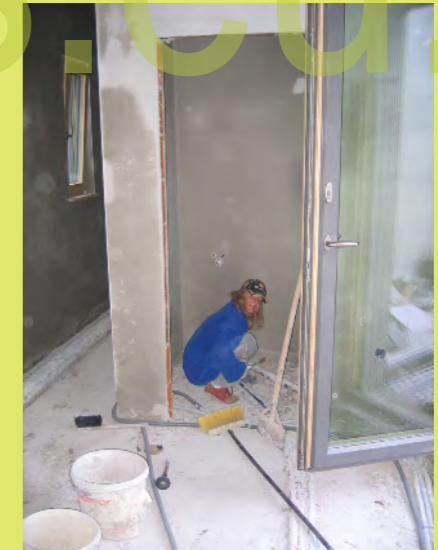
54_Großreinigung für den Estrich