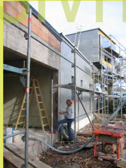
35_Und Pezi gipst noch immer