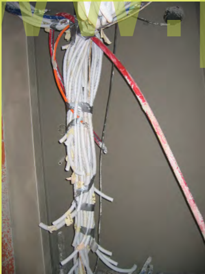
40_Schlauchchaos im Technikraum