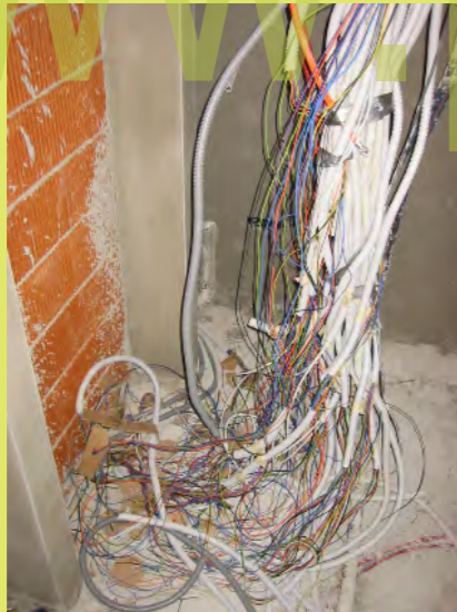
52_Kabel wirr-warr im Technikraum