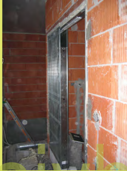
14_Schiebetürkasten im Bad