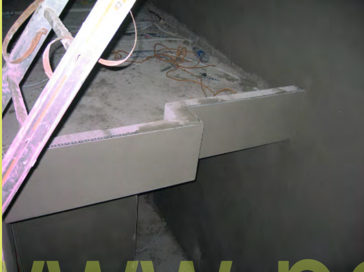
37_Das Treppenauge ist verputzt