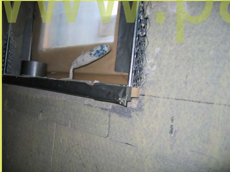
34_Putzanschluss am Fensterbrett