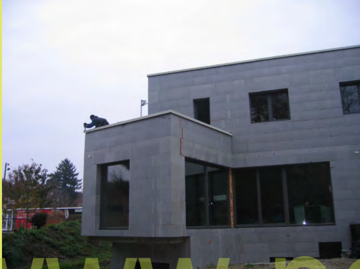
01_Die Haltebleche für die Attika Abdeckung werden...