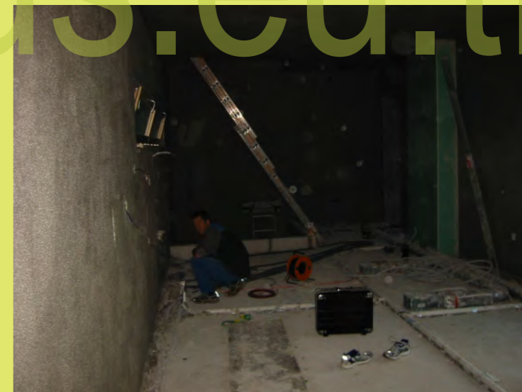
48_Mit Max beim Kabel einziehen