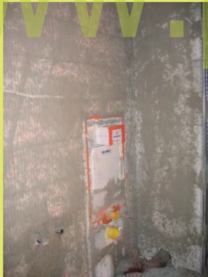
28_Der Vorspritzer ist schon drauf