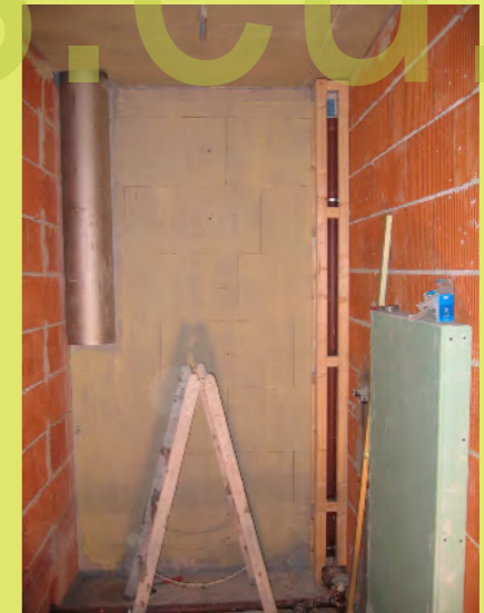
24_In der Waschküche wurde auch verbaut