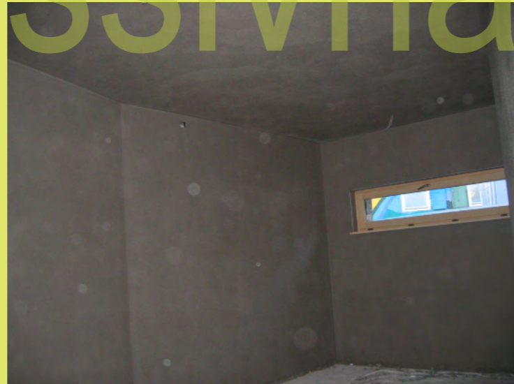
41_Der verputzte Kellerraum