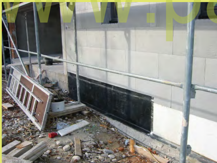
46_Die Bodenplatte des Nebengebäudes wird abgedi...