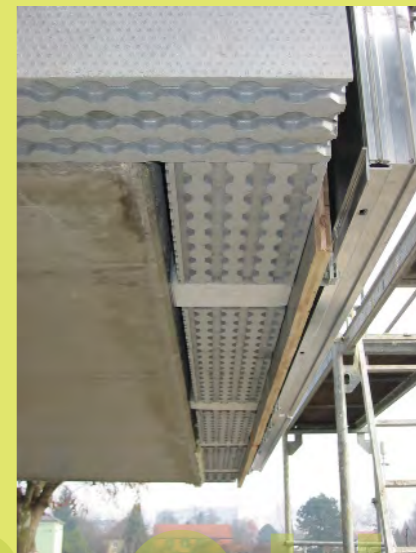
45_Die Randdämmung der Deckenauskrangung