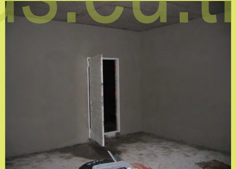
36_Nun ist auch die Garage verputzt