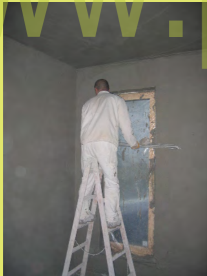
22_Artisten auf der Stehleiter