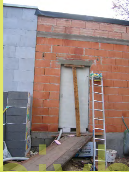
32_Der Fenstersturz wurde angepasst