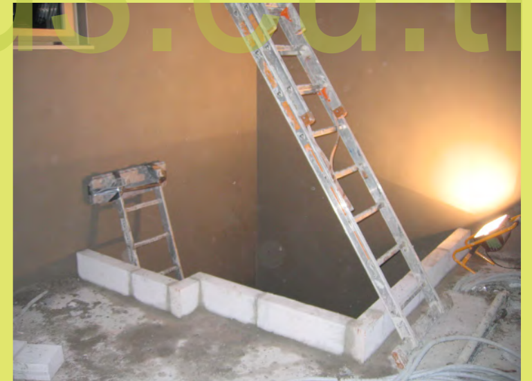
30_Bei der Treppe werden für den Bodenanschluss ...