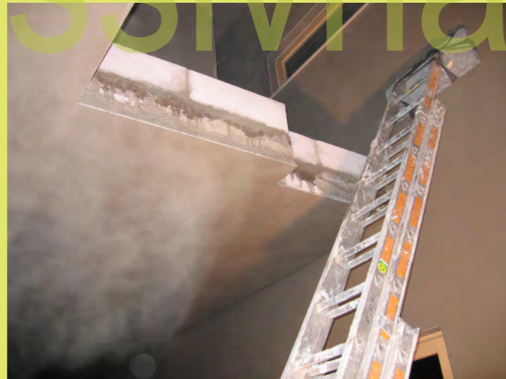
29_Der Treppenloch-Abschluss muss noch verputzt ...