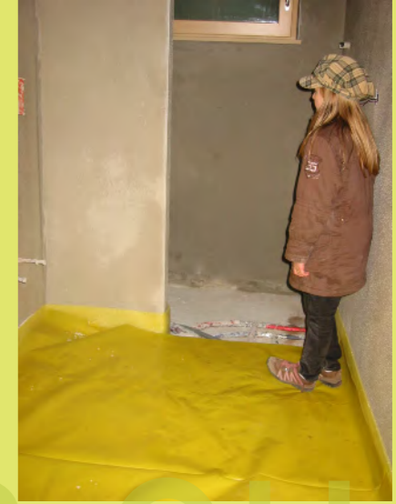
57_Vani inspiziert den Estrich-Unterbau