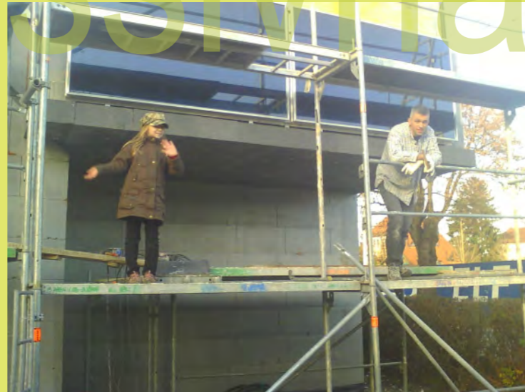
53_Die Untersicht ist warm eingepackt