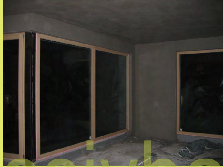
26_Sieht wieder ganz anders aus