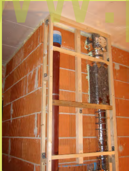
04_Die WC-Entlüftung und die Lüftungsanlage werd...