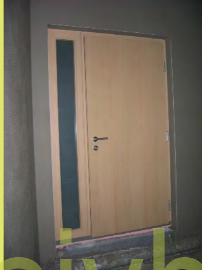
38_Die Haustür von Innen