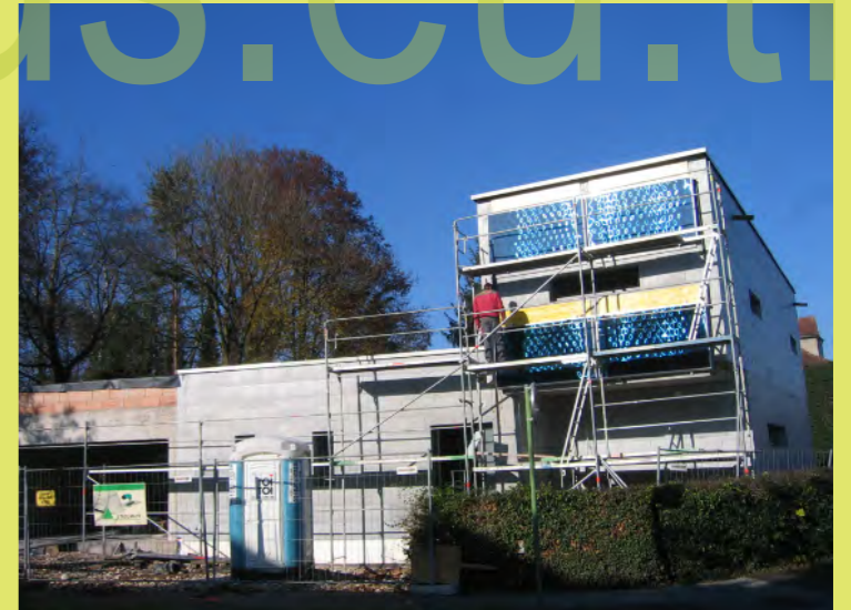
42_Das Putzsilo ist nun auch weg