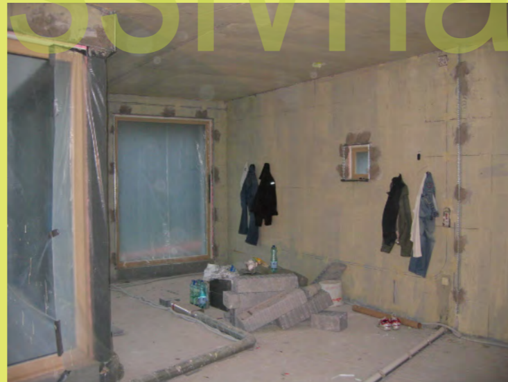
23_Auf die WTM-Wände musste ein Voranstrich drauf