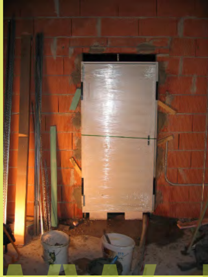
31_Die Brandschutztür in der Garage wurde eingebaut