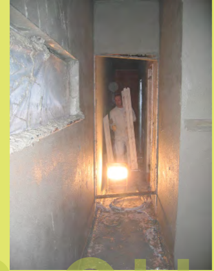
21_Die Putzer sind am Werk