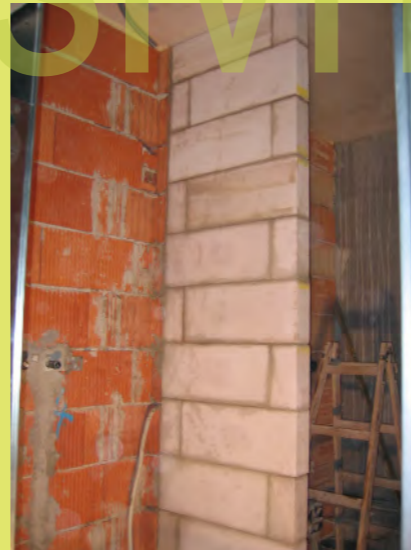
11_Und die Trennwand für die Dusche im OG