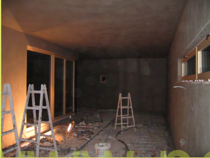
25_Nach dem putzen -ein Feld der Verwüstung