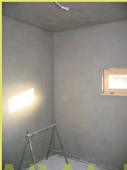
43_Licht in Vanis Zimmer