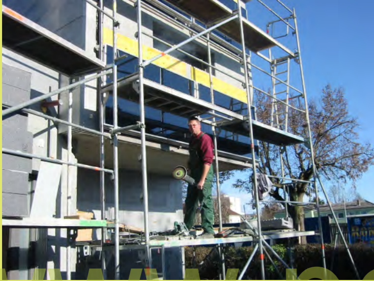
49_Bert mit schwerem Gerät