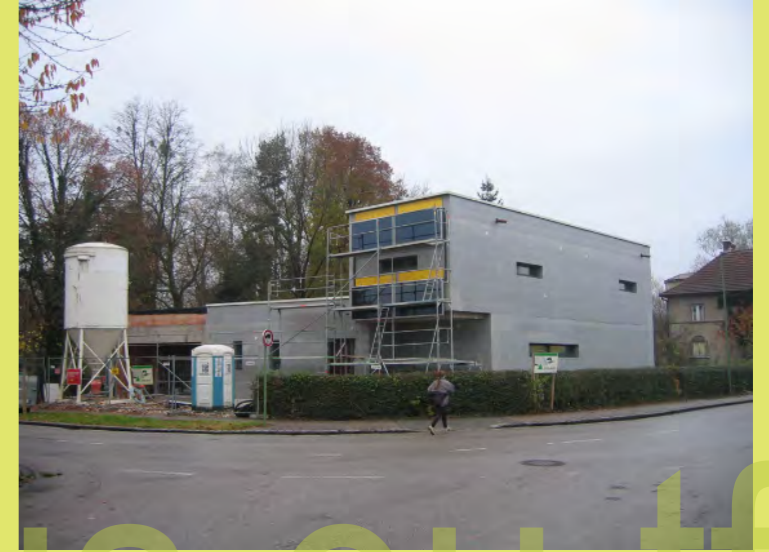
27_Neue Optik mit der Solaranlage