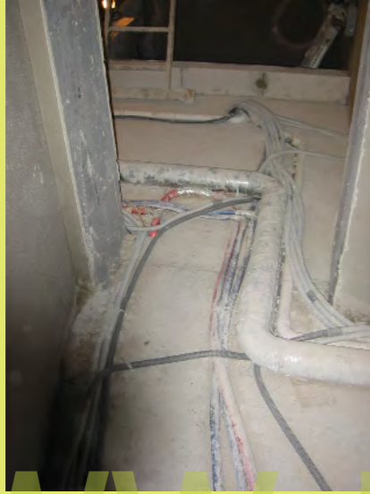
55_Die E-Schläuche sortieren