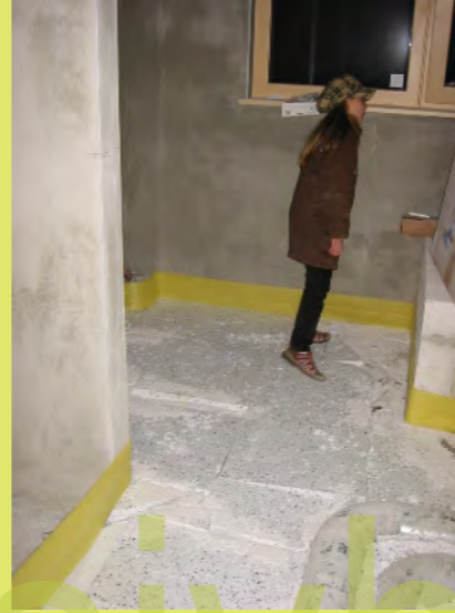
56_Dann können die Platten verlegt werden