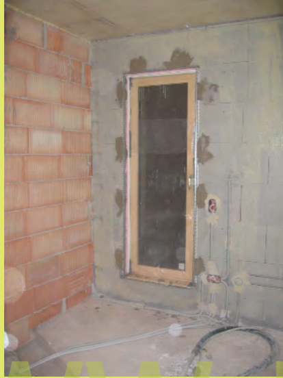
19_Die Putzer haben die Kanten montiert