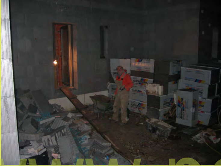
13_Nicht der Nachtwächter sondern Pa bei dr Arbeit