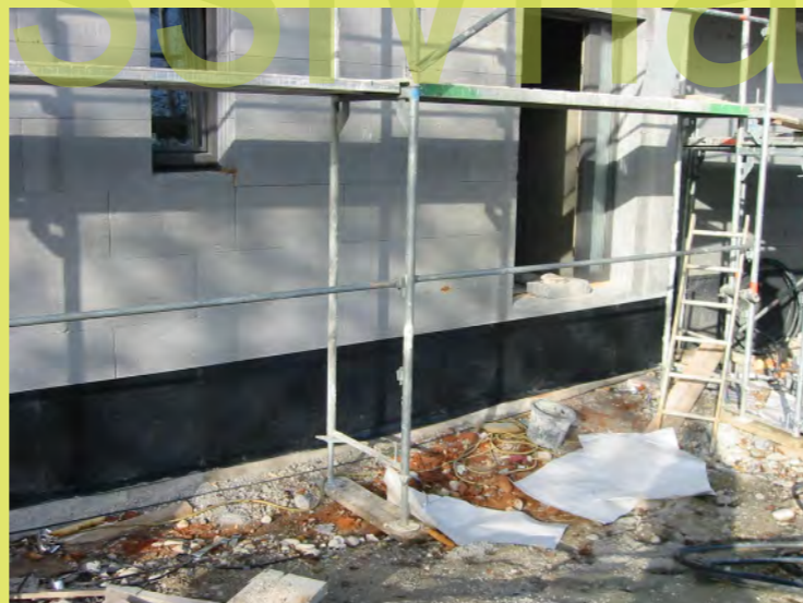
47_Abdichtung der Bodenplatte