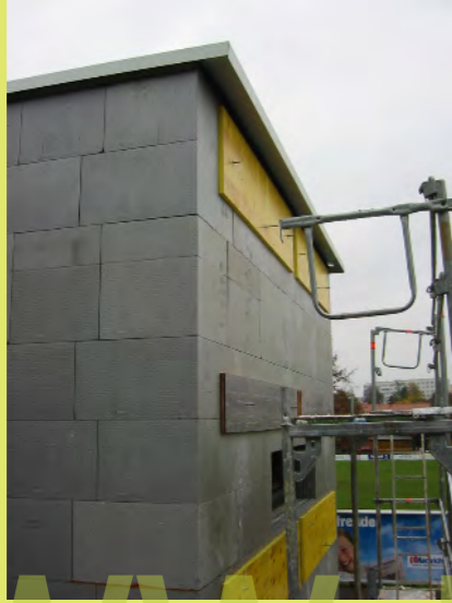
07_Die Solaranlage kann kommen