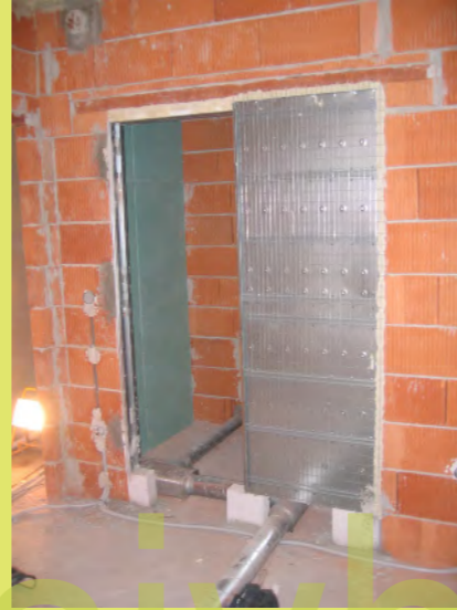
20_Eine Wand wurde mit Gipskarton geschlossen