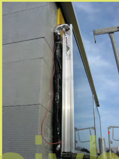
44_Die Solaranlage ist nun angeschlossen