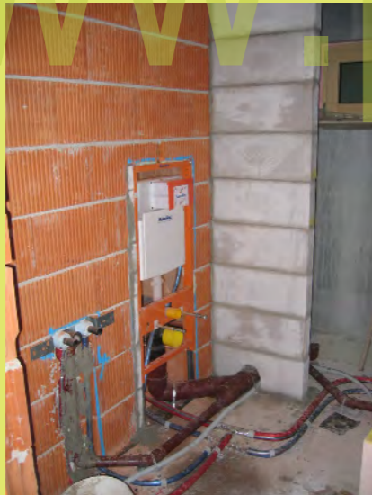
10_Die Trennwand für die Kellerdusche steht