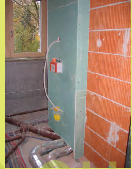
15_Die Rohre + Spühlkasten im Bad sind verbaut