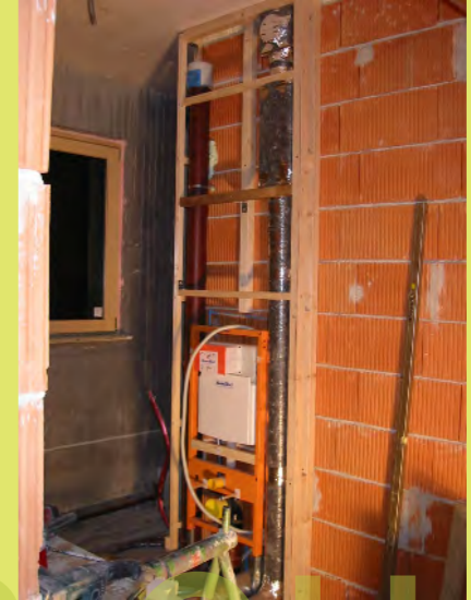
03_Der Verbau für den Spülkasten