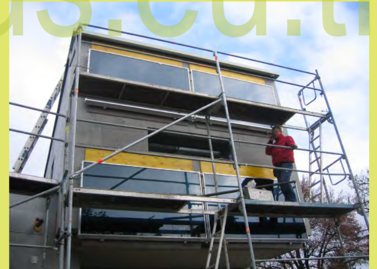
18_Die Solarpaneele sind montiert