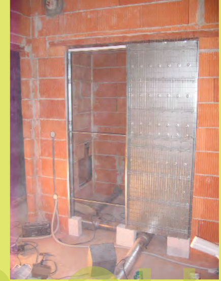
09_Schiebetürkasten für den Schrankraum