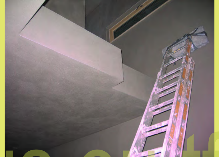
39_Das Treppenauge oben