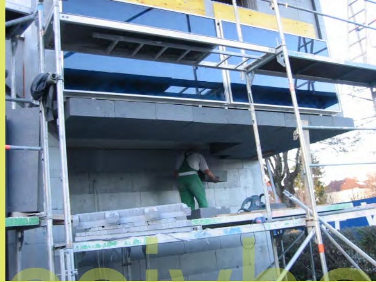
50_Pa dämmt die Untersicht der Auskrugung