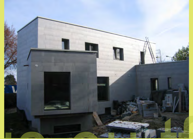
33_Lichteinfall am 16