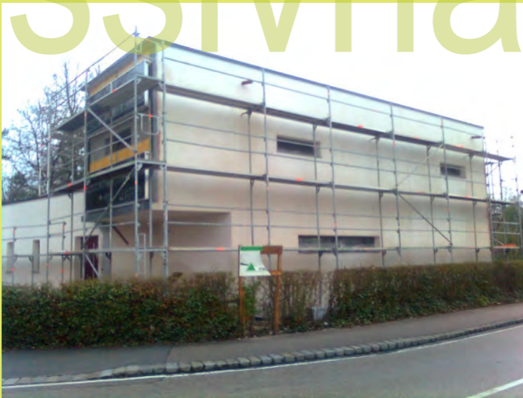
17_Nun wurde auch die Ostseite verspachtelt