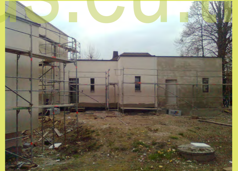
12_Und einen Tag später war der komplette Innenhof gespachtelt