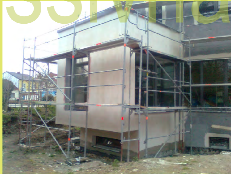
11_Dann wurde der Cubus verspachtelt