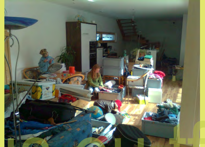
15_Aber das kann länger dauern