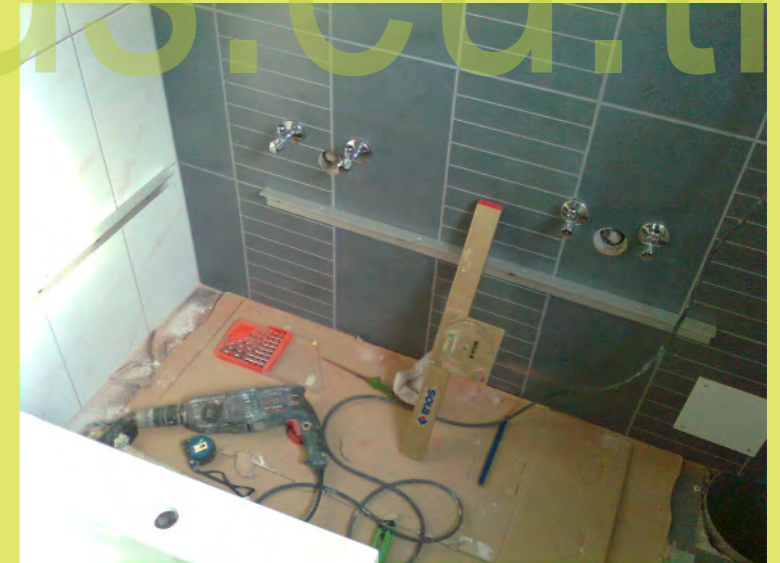
30_Und die Halterung für den Waschtisch montiert