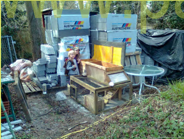
04_Die ersten die am 4 April einziehen sind unsere Hasen