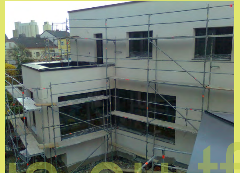
21_Komplizierter Gerüstbau war notwendig