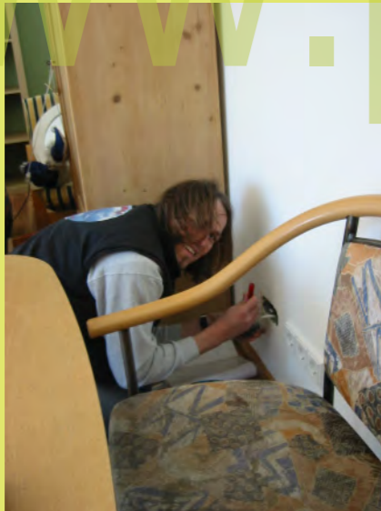
22_Die Installation der Schalter und Dosen benötigt viel Zeit