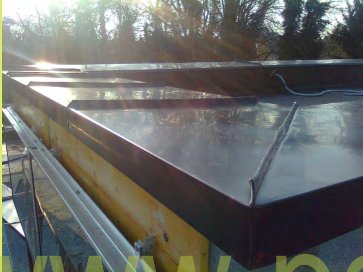
07_Und glänzt in der Abendsonne