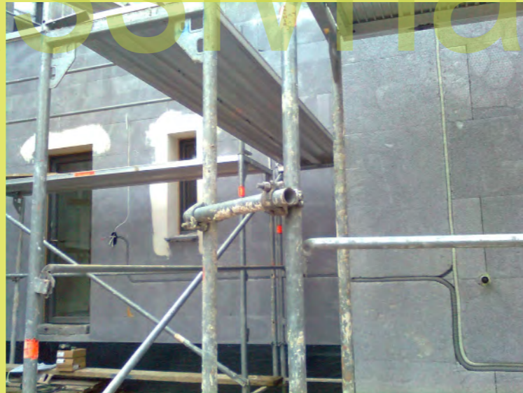
05_Bevor das Gewebe aufgespachtelt wird die E-Außenverrohrung