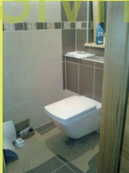
23_Das erste WC ist montiert