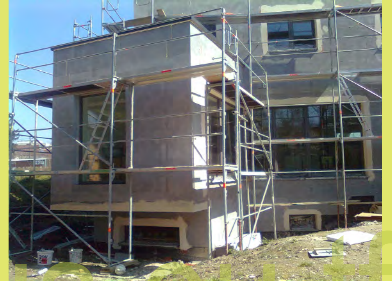
09_An den Auskragungen werden Tropfnasen aufgespachtelt