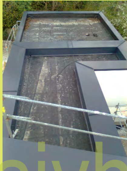
20_Auch das Nebengebäude ist verblecht