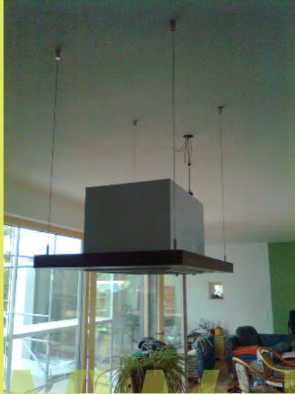
25_Nun ist auch das UFO gelandet - unser Dunstabzug