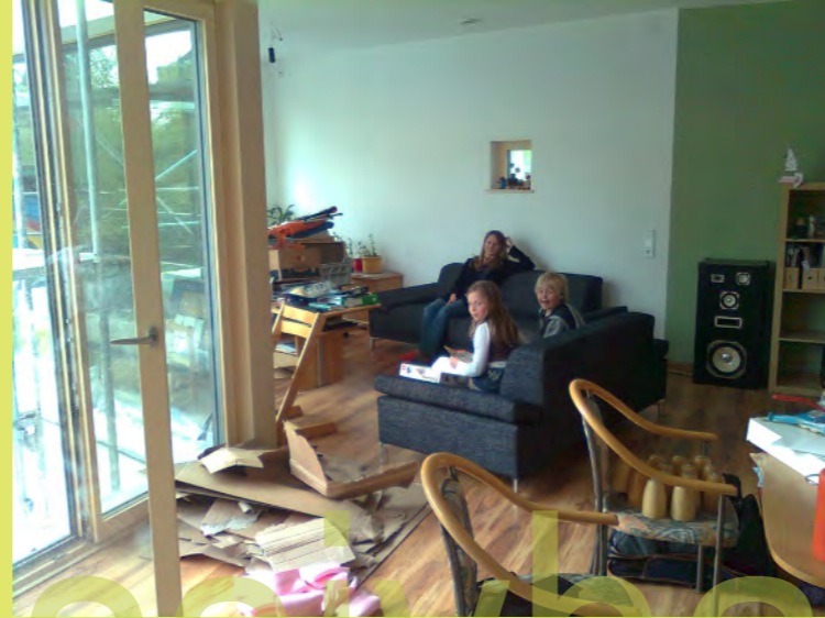
26_Jetzt können wir endlich gemütlich sitzen - die neuen Sofas si...