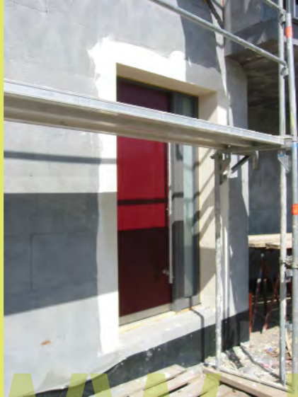
01_Begonnen wird mit dem Verspachteln der Tür- und Fensterlaibungen