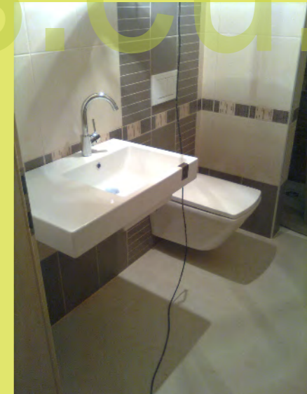
24_Dann kommt das Bad im Keller