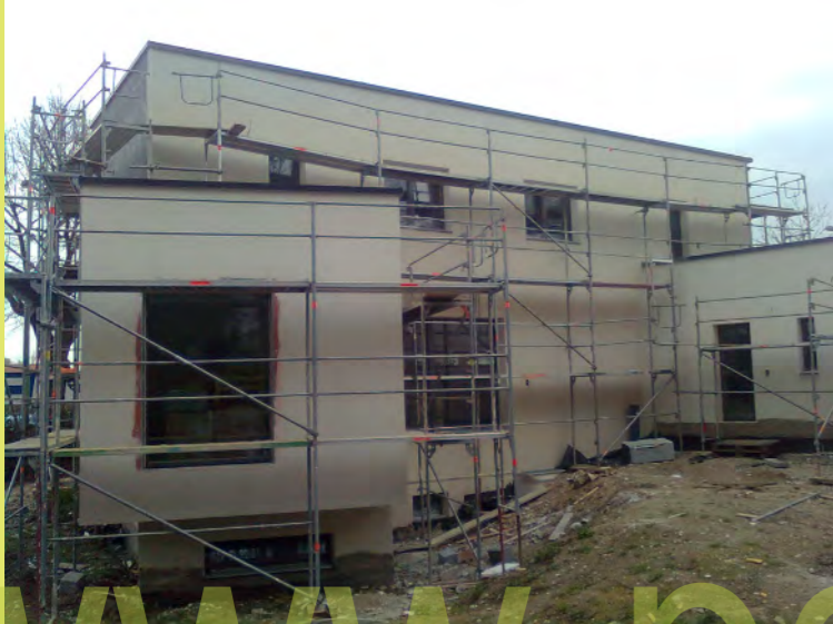
13_Im Bereich der Gred wurde ein spezieller Sockelputz aufgespa...