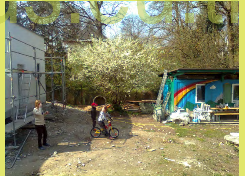
18_Die Kinder machen im Garten ein Downhill-Rennen