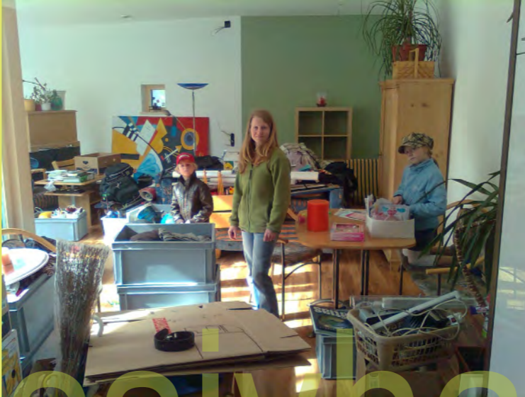
14_Innen wird das Umzugschaos beseitigt