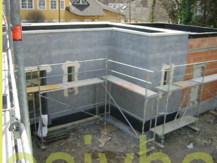
02_Und der Fensterlaibungen mit Gewebe