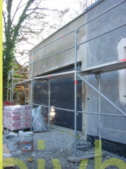
08_Die Garage wird mit Grundputz auf gleiches Niveau gebracht