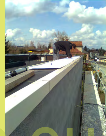
03_Der Dachdecker montiert die Attikaverblechungen