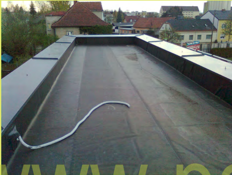
19_Das Hauptdach mit der Attikaverblechung