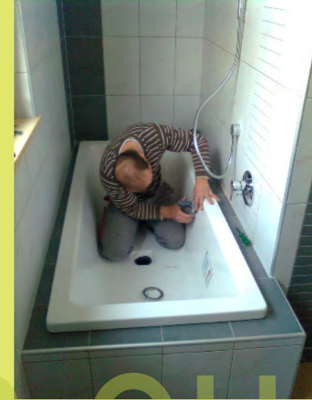
27_Ein Geduldsspiel für den Installateur - die Installation der Bad...