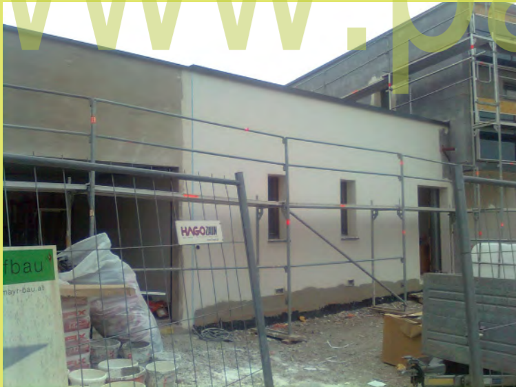
10_Die Südseite mit Netz und Spachtelung