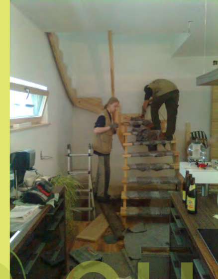
03_Das Kernesche-Schmuckstück aus dem Innviertel wird montiert