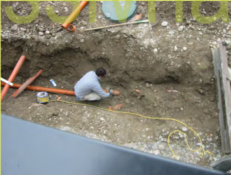
28_Genaues Arbeiten ist gefragt - viele Rohre