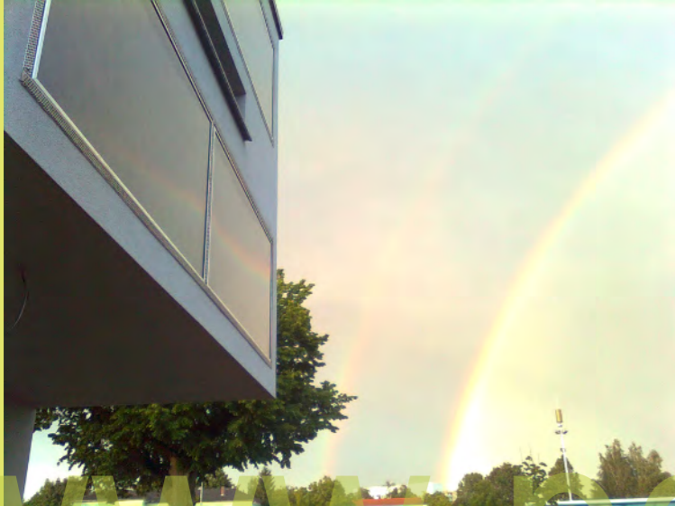
48_Die Wolken lichten sich und es klart auf