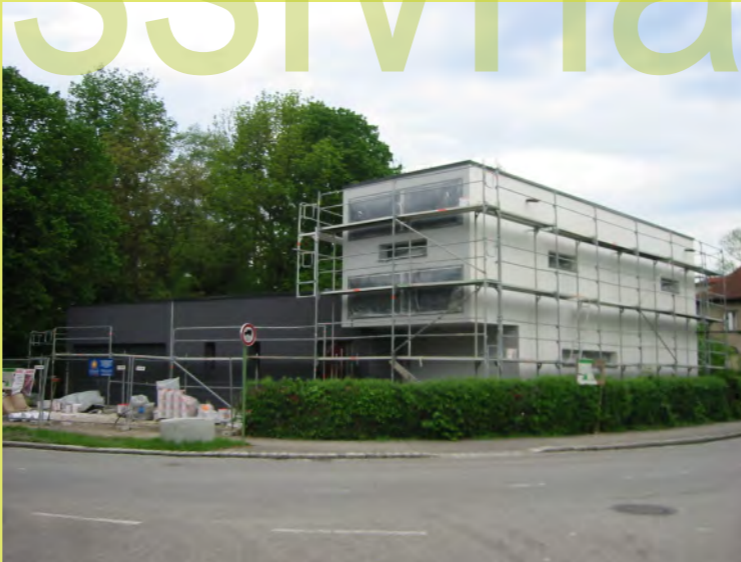
22_Und die Strassenseite hat auch ein Putzkleid