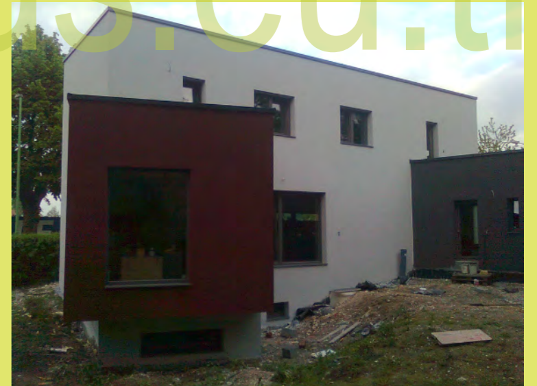
29_Die Ersten Eindrücke ohne Gerüst