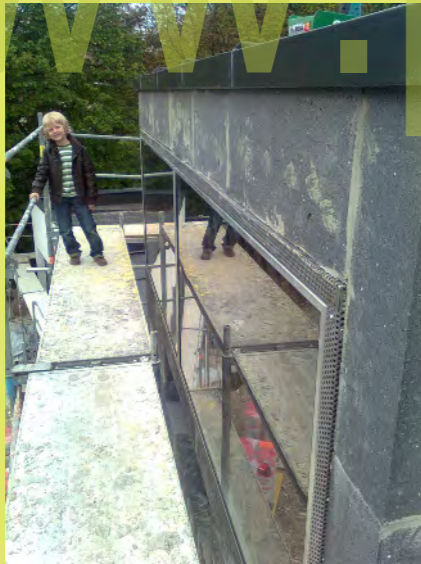
10_Elias macht noch eine Qualitätskontrolle - alles OK