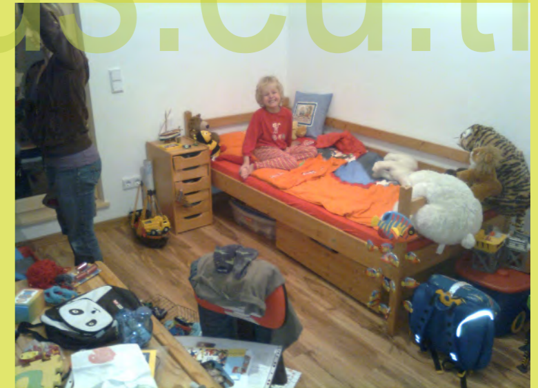
47_Die erste Nacht in unserem neuen Heim