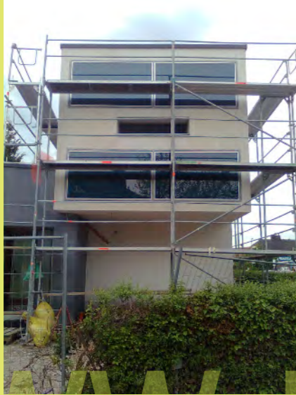
13_ Und nun ist auch die Solarfassade verspachtelt