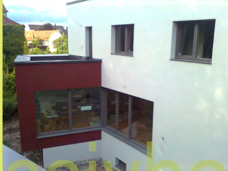
31_Noch führt die Terrassentür ins Leere