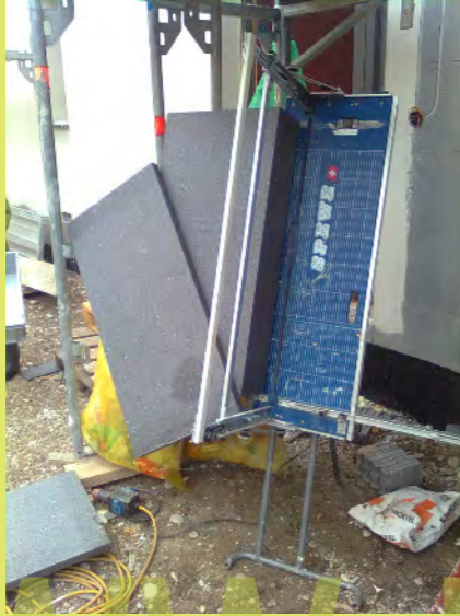
07_Bei stürmischem Wind dämme ich die Solarfassade noch aus