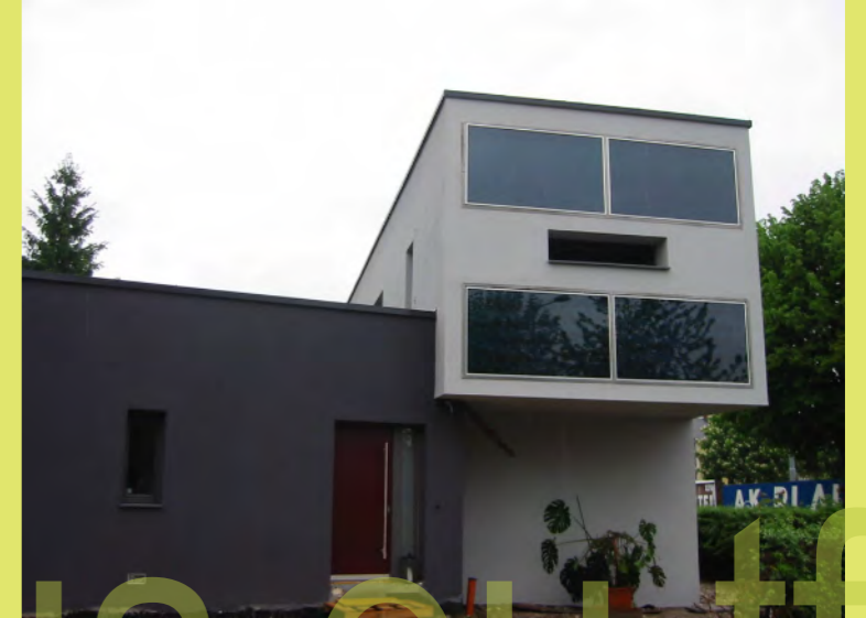
32_Ist das nicht ein freundliches Gesicht