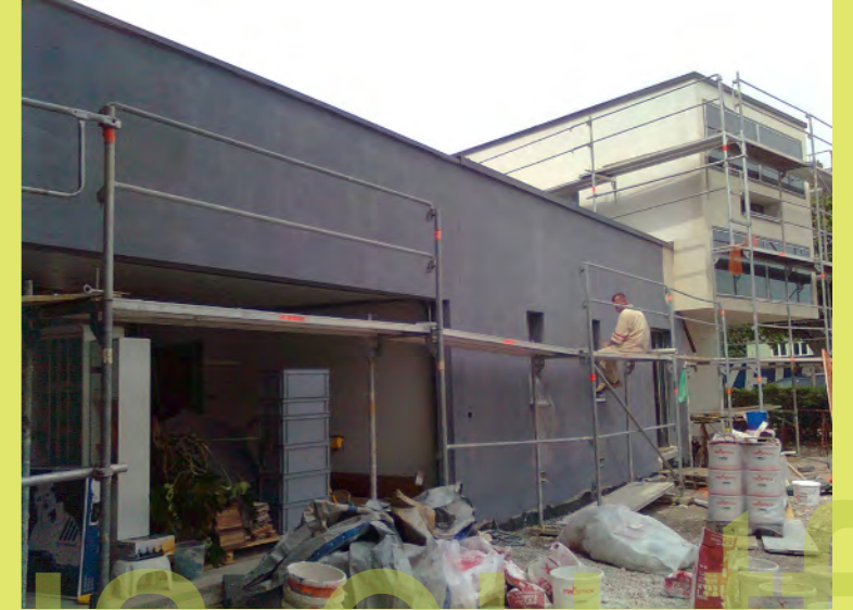
15_ Farbe kommt ins Leben - der Grundanstrich