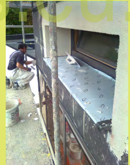
12_Die Fensterbank der Südseite ist ziemlich breit