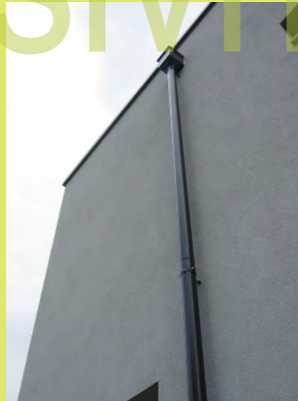
34_Und die Fangkästen für das Wasser