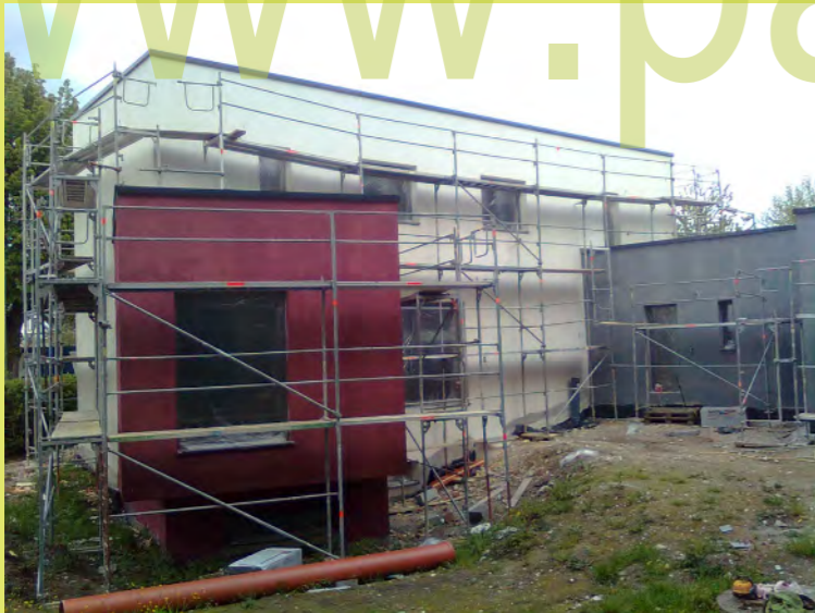
16_ Noch etwas blas aber farbig