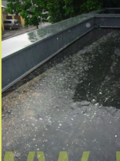
36_Wenig später erfolgt die Feuertaufe mit einem Wolkenbruch