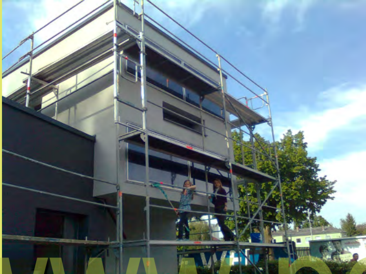
24_Und Pezi bringt unsere Kollektoren auf Hochglanz