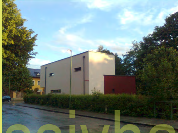
49_Der Knoten der Probleme hat sich gelöst