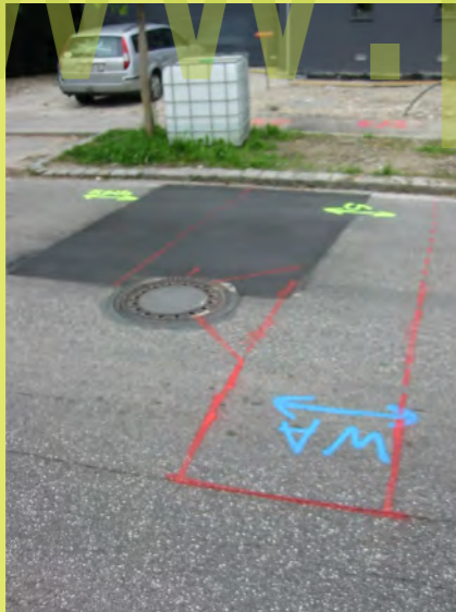
39_Erste Zeichen dass wir doch noch einen Kanalanschluss bekom...