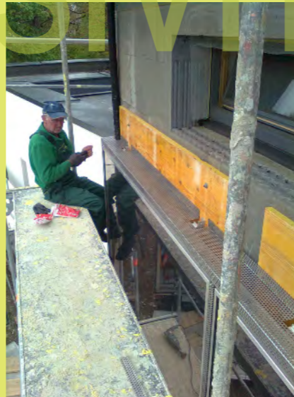
05_Zeitgleich kümmern sich Pa und ich um die Seitenlüftung der S...