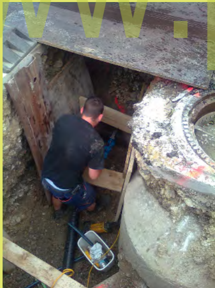
45_Und den lange ersehnten Wasseranschluss