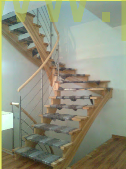
04_Nach nur einem Tag ist die Treppe fertig