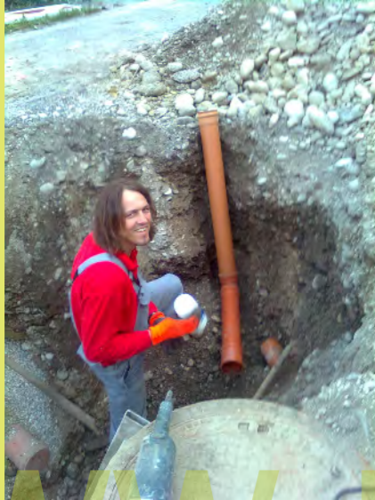
42_Das Abflussrohr für die Regenrinne muss repariert werden