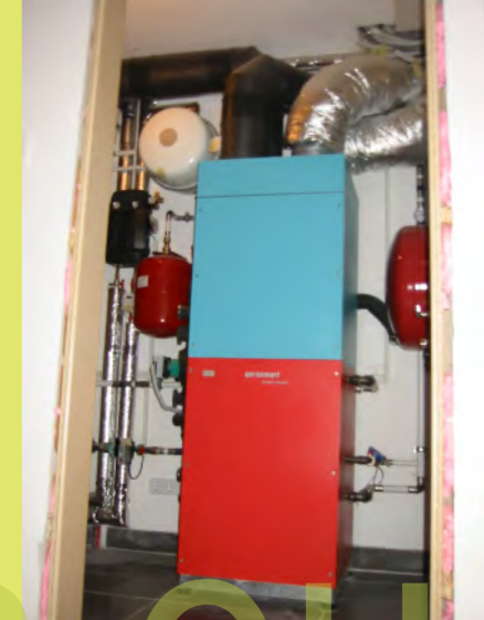
38_Das Kompaktgerät geht in Vollbetrieb