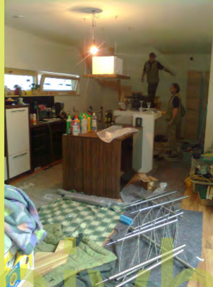
02_Unser wichtigstes Möbelstück kommt - unsere Treppe