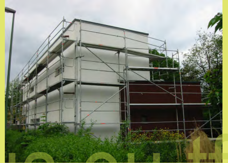
21_Auch die Nordseite ist verputzt