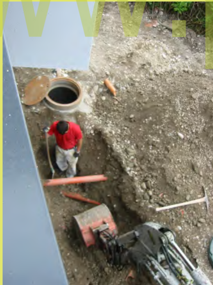
27_Das Rohr des Hebeschachtes muss tiefer gelegt werden