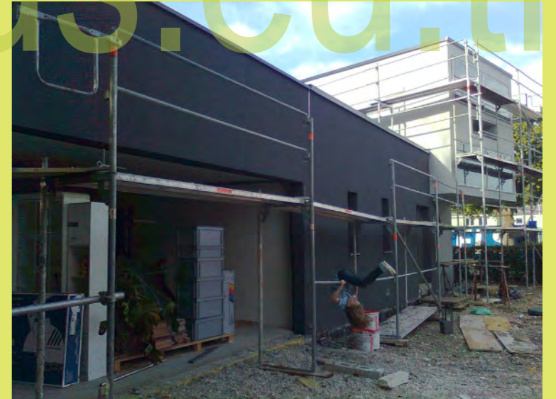
23_Vanessa turnt noch ausgiebig bevor das Gerüst verschwindet