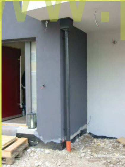
33_Der Dachdecker montiert die Regenfallrohre