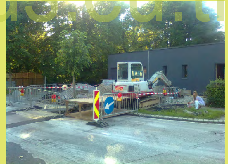
41_Und die Grabungsarbeiten werden gestartet