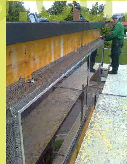
06_Eine Lochblechverkleidung sorgt für die nötige Luftzirkulation