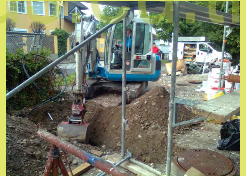
18_ Die Reparatur des Kanals beginnt