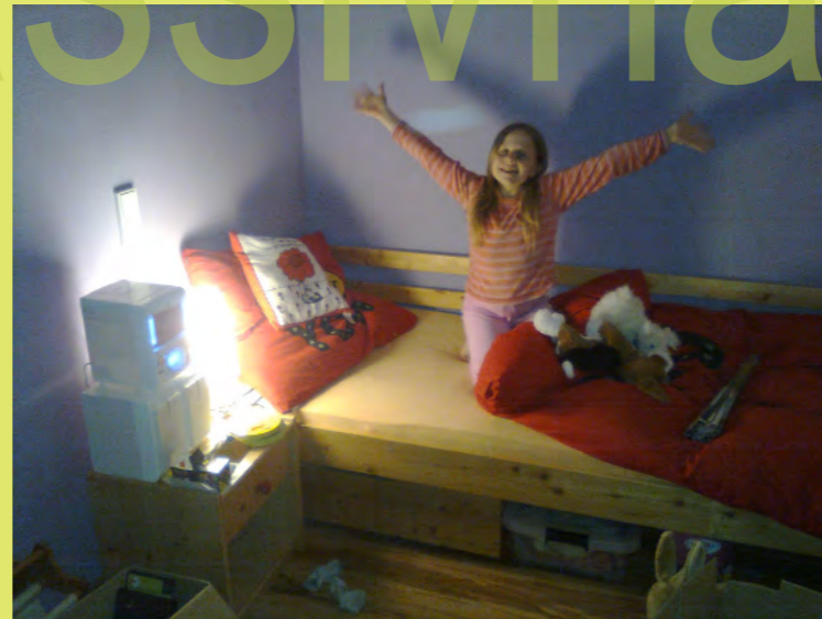
46_Die Freude ist groß - am 29 Mai ziehen wir ein