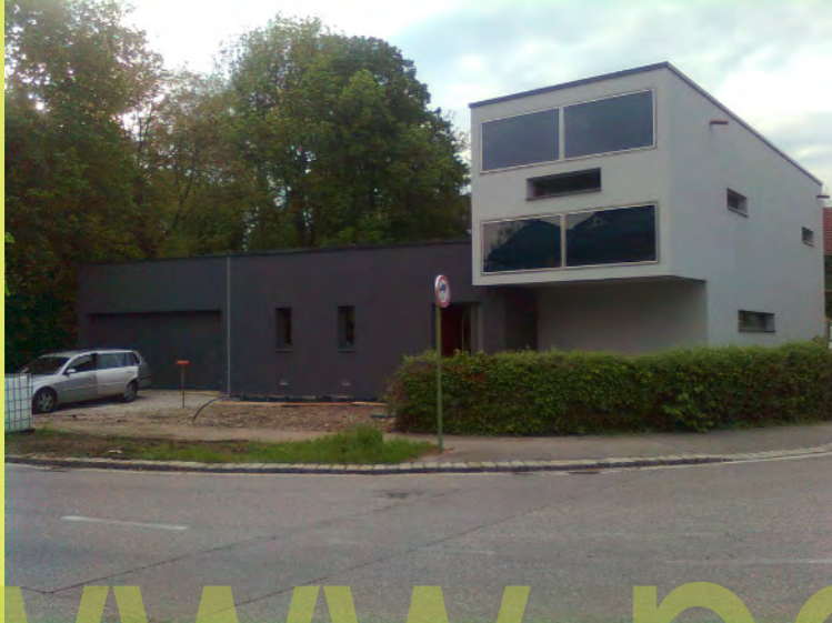
30_Es wirkt toll - so wollten wir das haben