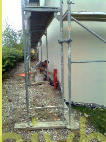
14_ Der Sockelputz auf der Ostseite wird aufgebracht