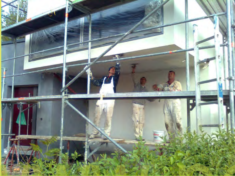
19_Verspachtelung der Auskrugung auf der Südseite