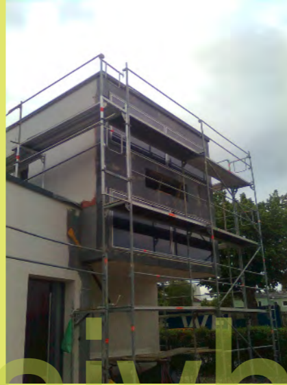
08_Sodaß eine Ebene entsteht