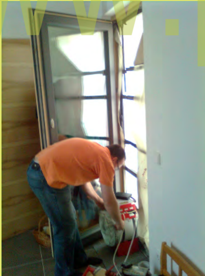
22_Jetzt ist Zeit für den Blower-Door-Test - 0,22 ein Super Wert