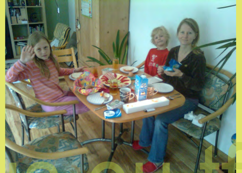
50_Wir genießen unser erstes Frühstück im neuen Heim