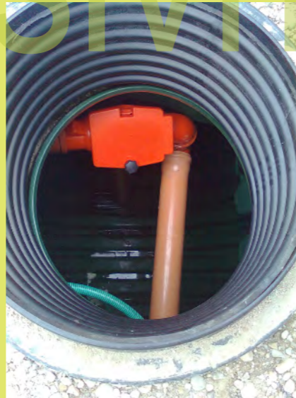
17_ Die Innenverrohrung des Regenwassertanks