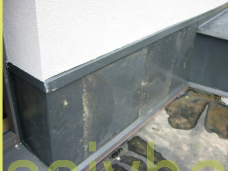
37_Auch die Anschlussbleche werden montiert