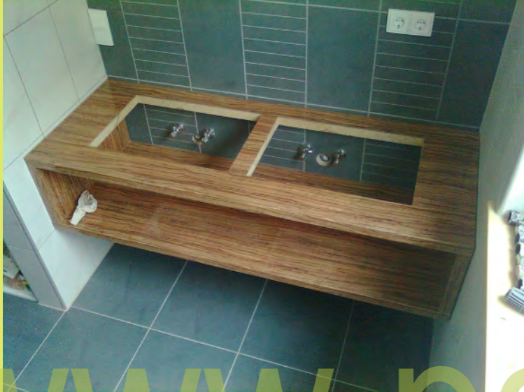
01_Der Waschtisch ist montiert