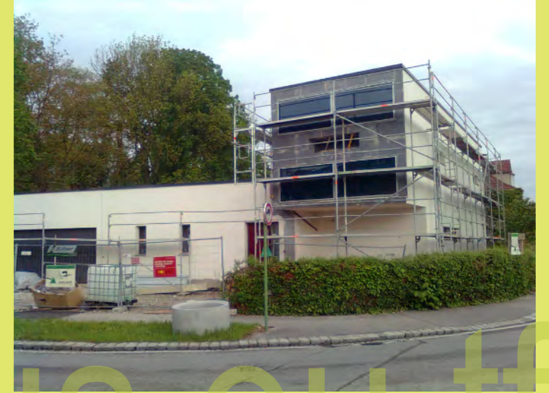
09_Die Solarfassade ist fertig zum verspachteln