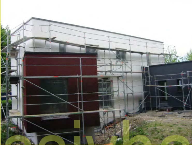
20_Und jetzt mit dem Deckputz in der endgültigen Farbe