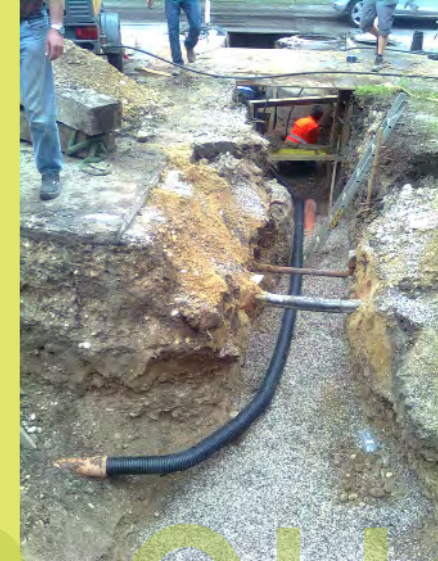
44_Nach wochenlangem hin und her bekommen wir unseren Kana...