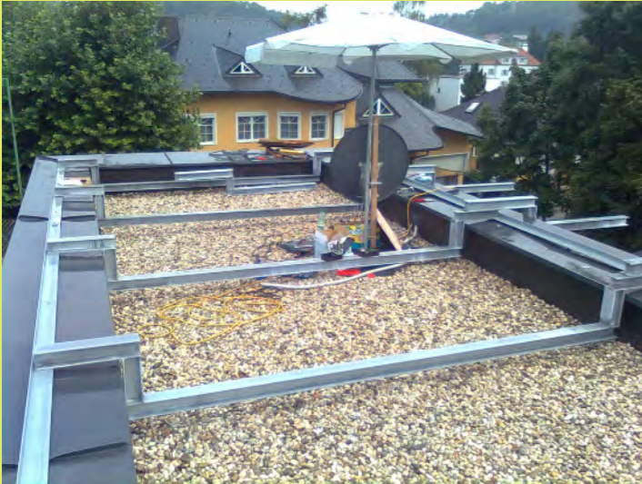
13_Das Wetter verlangte einen Regenschutz