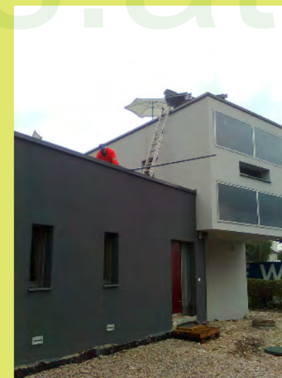
12_Baustelleneinrichtung für die Trägermontage