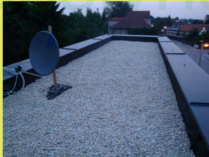
05_Auch am Hauptdach kommt heller Kies