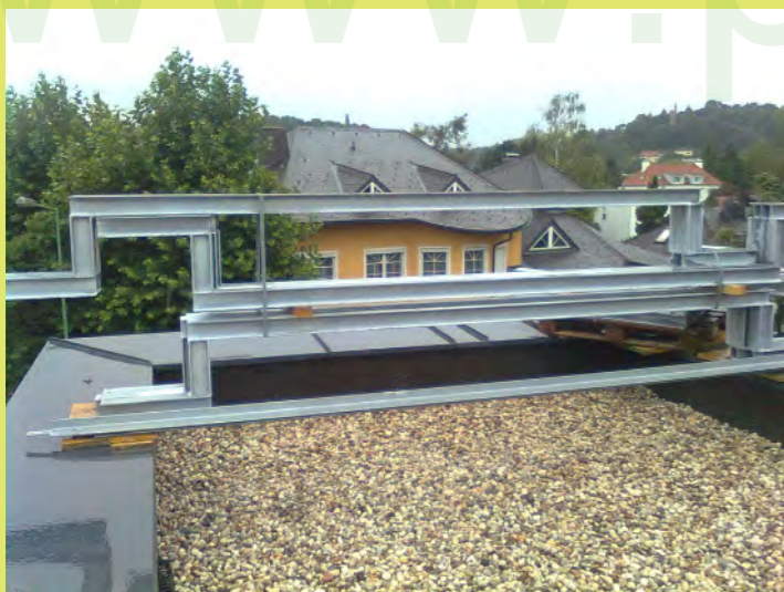
10_Sie sind da wo sie gebraucht werden