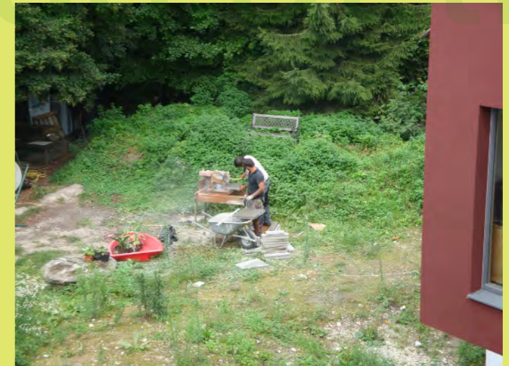
06_Unten wird geschnitten