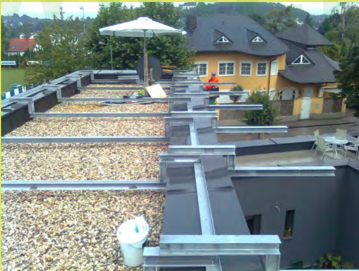
16_Und die Auskragungen für die Beschattung