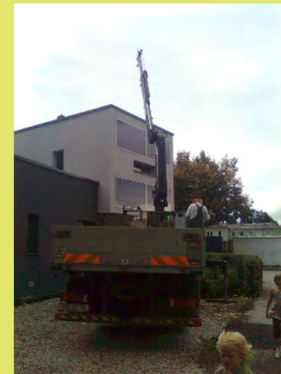
09_Der Kran ist gerade lang genug