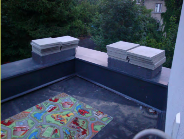
01_Die Platten für die Dachterrassen