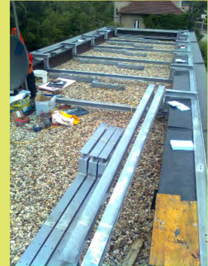
15_Ein Netz für die Aufnahme der PV