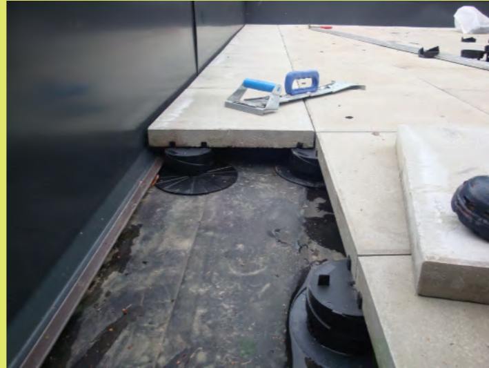
02_Abstandhalter damit das Wasser Platz hat