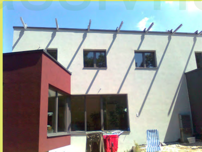
17_Hier sieht man schon wie weit der Schatten fällt