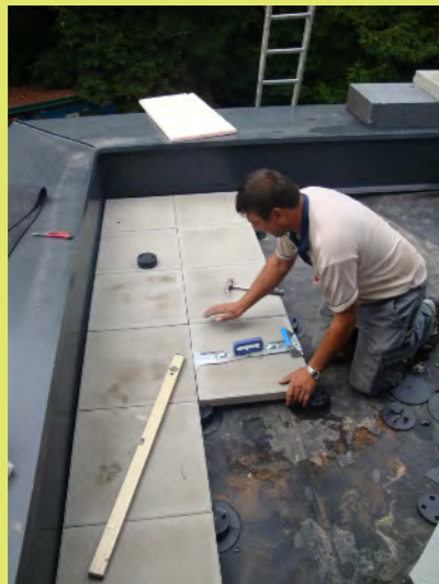
07_Und dann rauf - Schwerarbeit