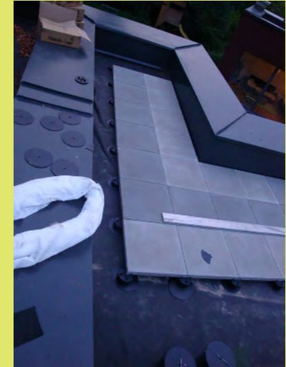
03_Stein an Stein