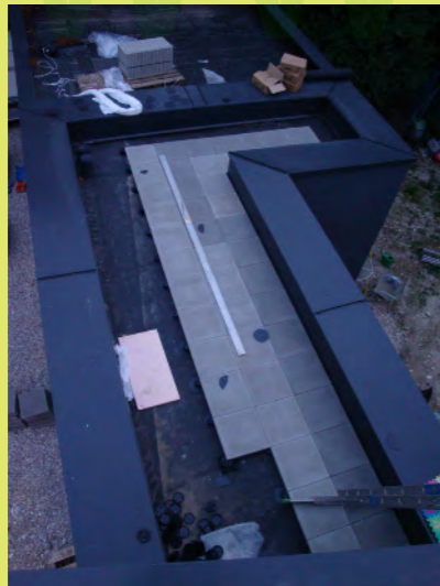
04_Helle Steine wegen der Rückstrahlung