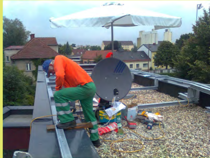
14_Montage der Stahlträger