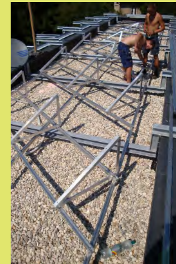
03_Dann wird exakt ausgerichtet