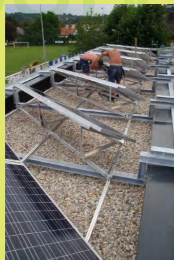
05_Verkabeln damit der Strom fließen kann