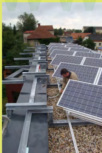
10_Und schliesslich wird zusammen geschlossen