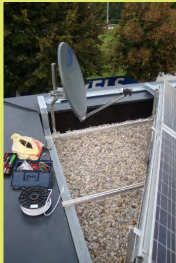
07_Ein neues Platzl für den SAT