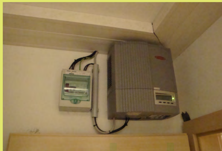
08_Der PV-Wechselrichter wird montiert