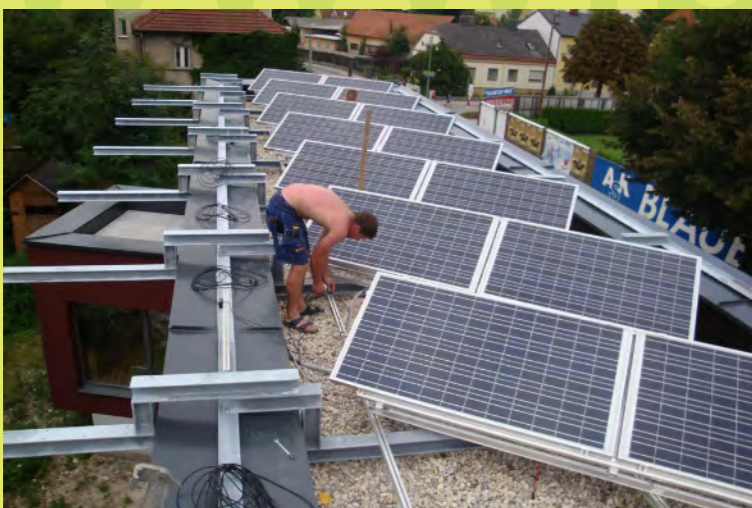
04_Und die PV-Module montiert