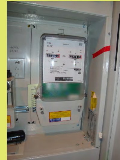
09_Und natürlich der Zähler für die PV-Anlage