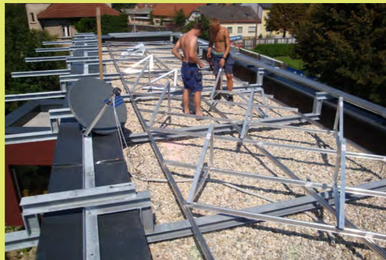
02_Die Aufständerung für die PV-Anlage wird montiert