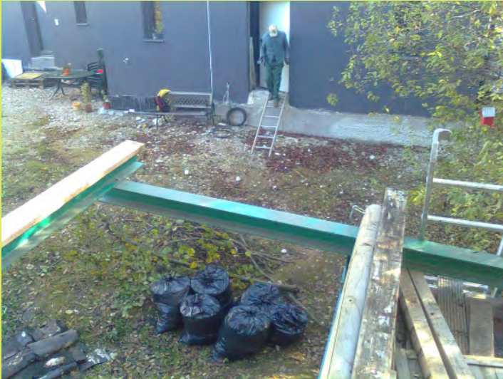
01_Unserem Baucontainer schlägt die letzte Stunde