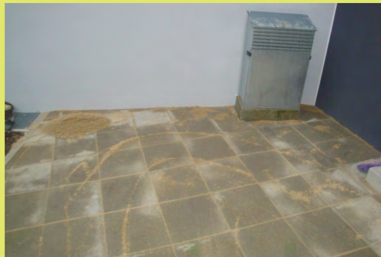
32_Jetzt wird noch der Sand eingekehrt