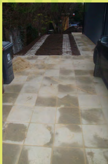
29_Rasengitter bei der Gartenzufahrt