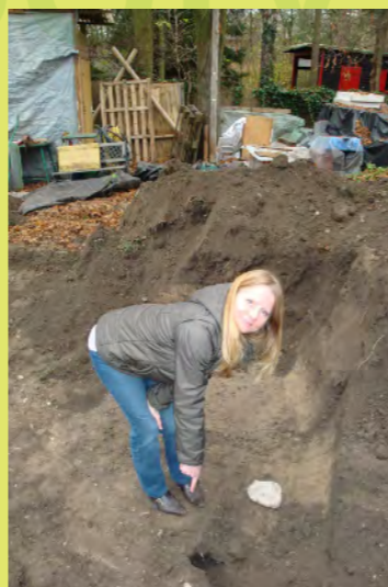
11_Der Bagger entdeckt einen 10m langen Hasentun...