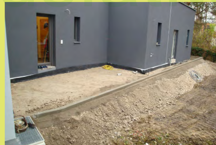
12_Leistensteine und Grobplanum im Hof