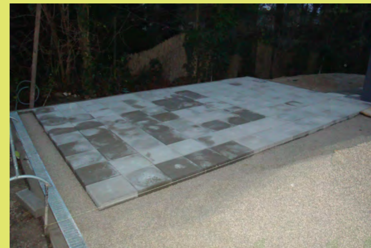
21_Die Abstellfläche neben der Garage auch