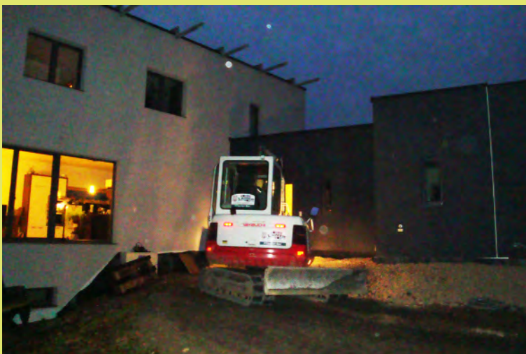
07_Viel Erde muss bewegt werden