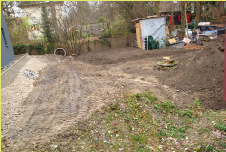
13_Der Mutterboden wird ausgebracht