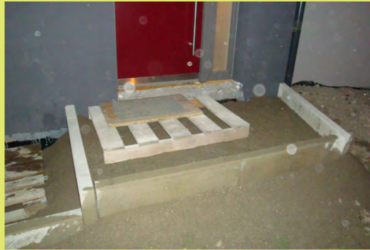
14_Das wird das Eingangspodest