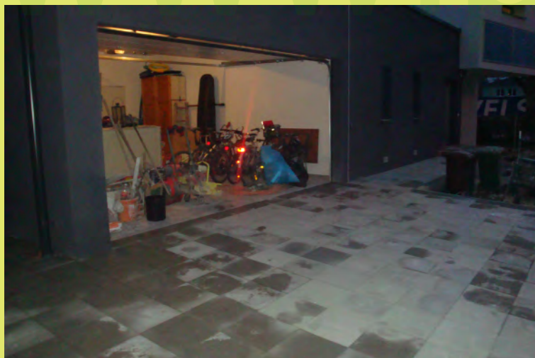
28_Und auch der Garagenvorplatz fertig