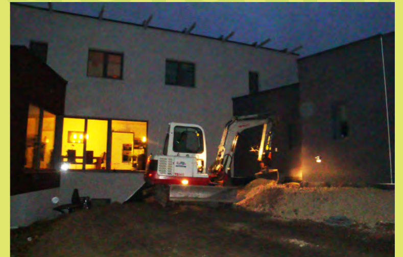
06_Der Bagger beginnt mit der Terasse