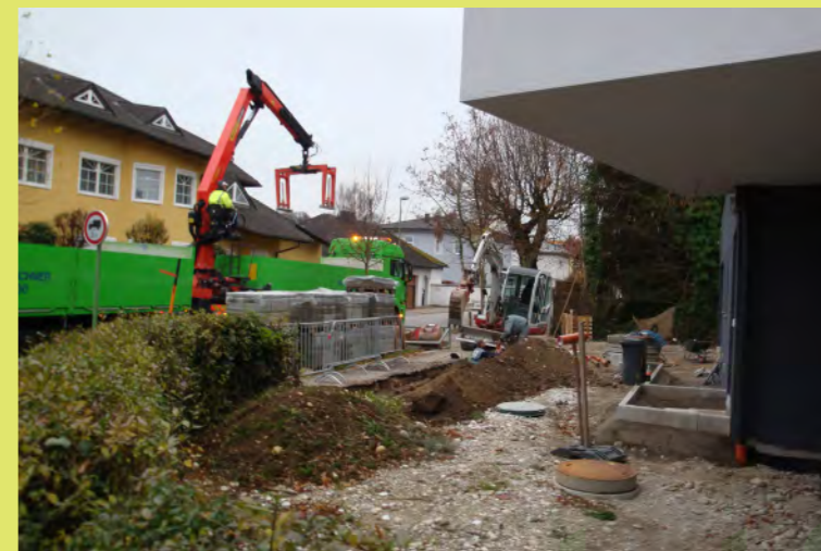
09_Die Steine kommen