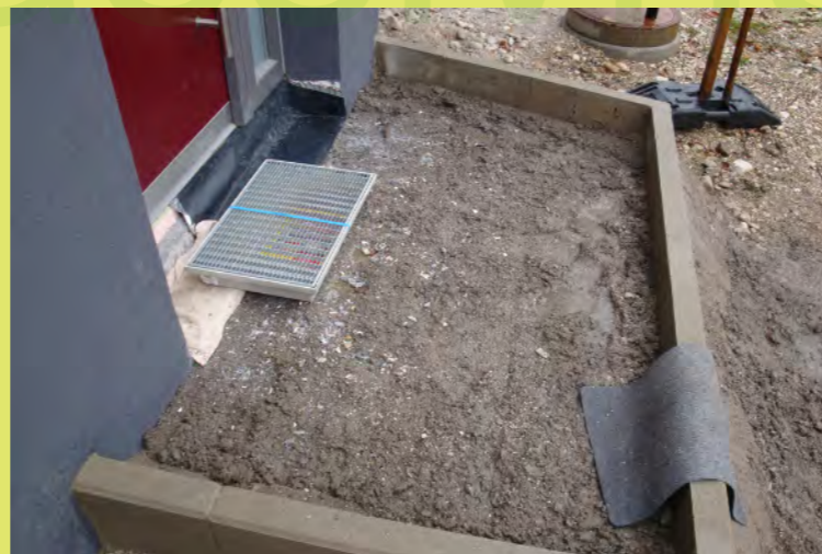
23_Der Beton wird gelöchert zwecks Ablauf