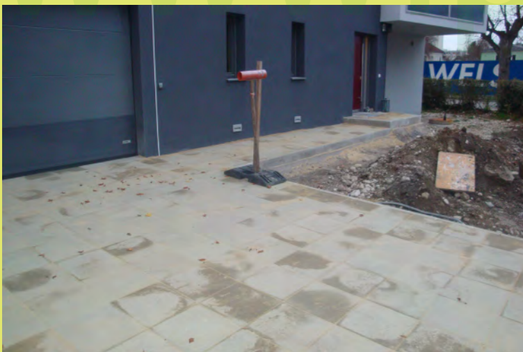
34_Projekt Pflaster ist fertig