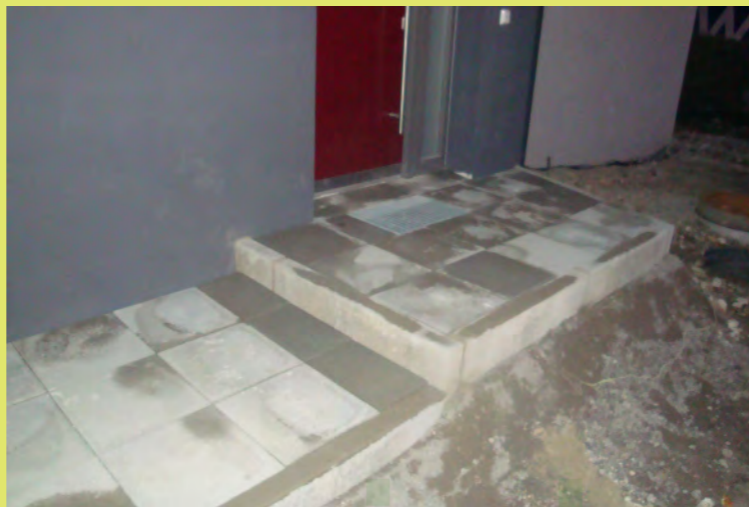
26_Und endlich das Eingangspodest