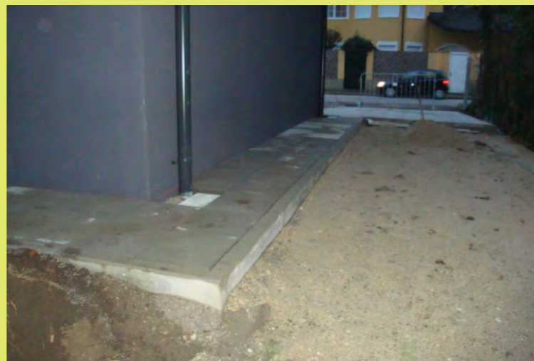
20_Der Weg ist gepflastert