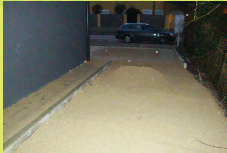
17_Die Gartenzufahrt nimmt Form an