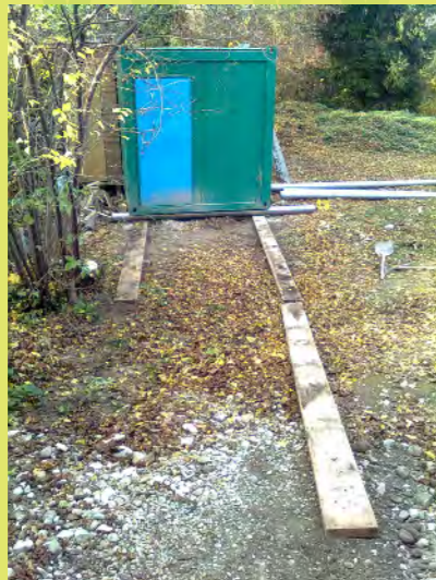
04_Die Rollbahn für den Container