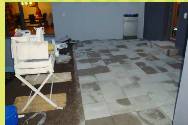
24_Auch die Terasse hat schon Pflaster