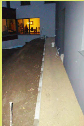
19_Die Gartenböschung ist modelliert