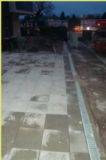
25_Die Regenrinne der Garageneinfahrt