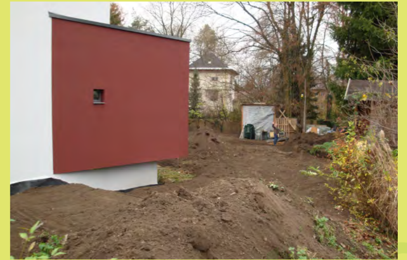
15_Hier wird der Gemüsegarten modelliert