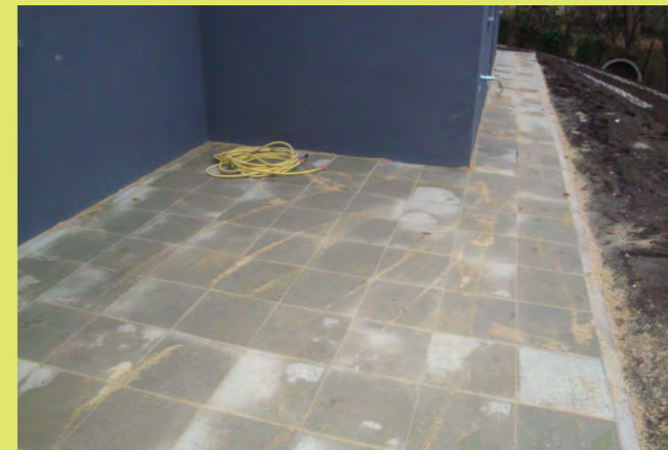
33_Damit die Fugen gefüllt werden