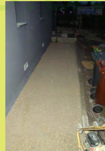
18_Das Feinplanum des Zugangsweges