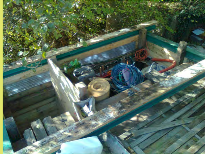
02_Das Überdach wird demontiert