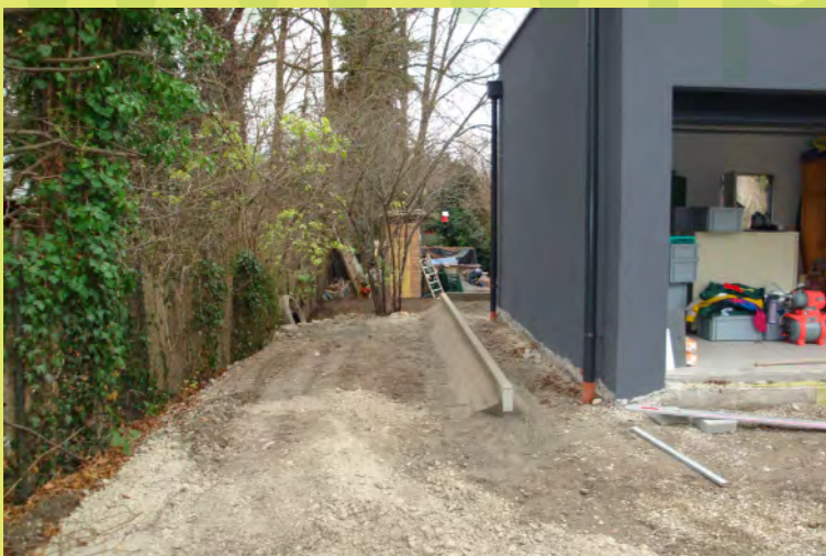
10_Die Leistensteine sind gesetzt