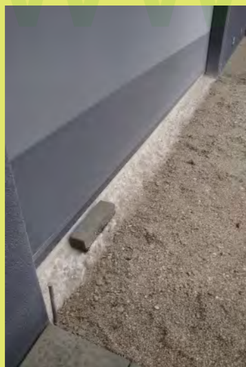
22_Stemmarbeit-der überschüssige Estrich muss weg