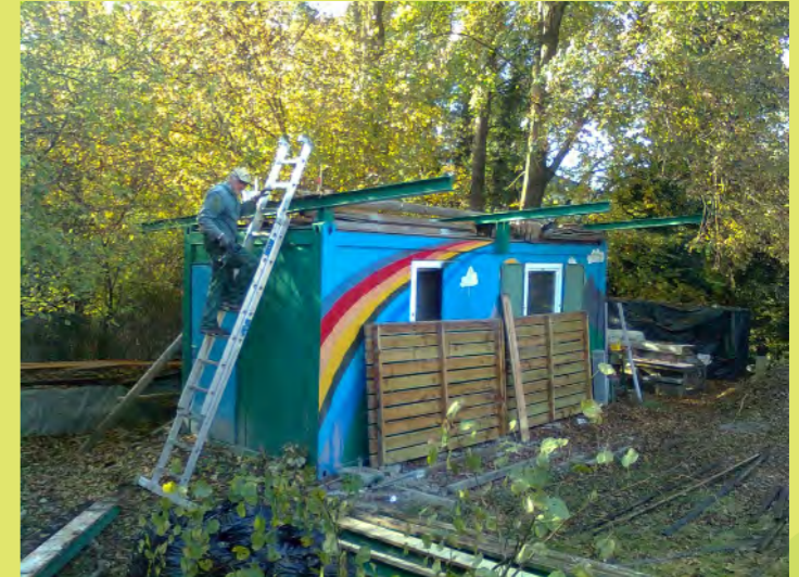
03_Alles muss runter und raus