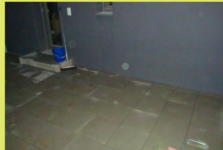
27_Die letzten Einschnitte