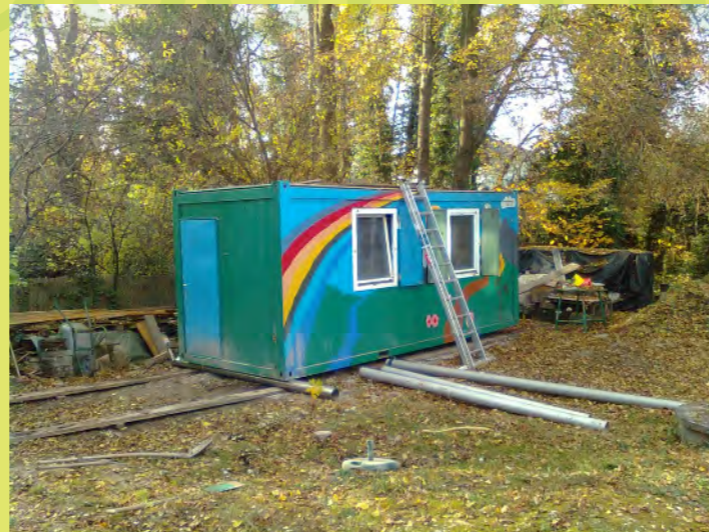
05_Wie die Wickinger rollen wir ihn raus