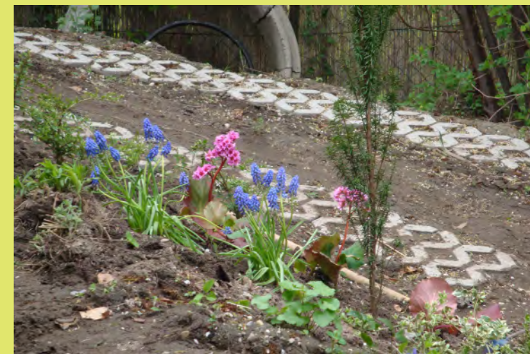
21_Das Leben in der Kolpingstrasse wird bunter