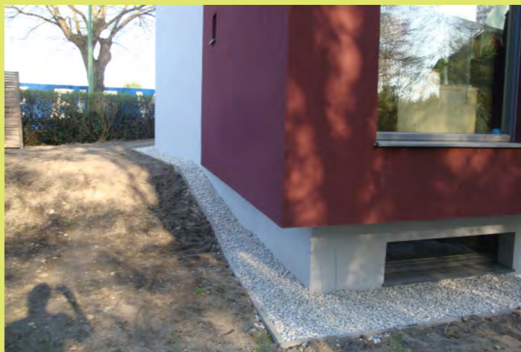
14_Sieht ja schon ganz Ordentlich aus