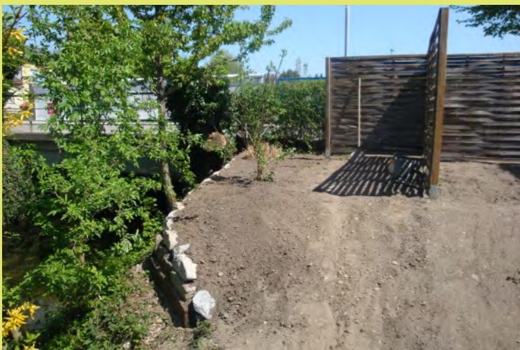
49_Dadurch gewinnen wir etwas flaches Land