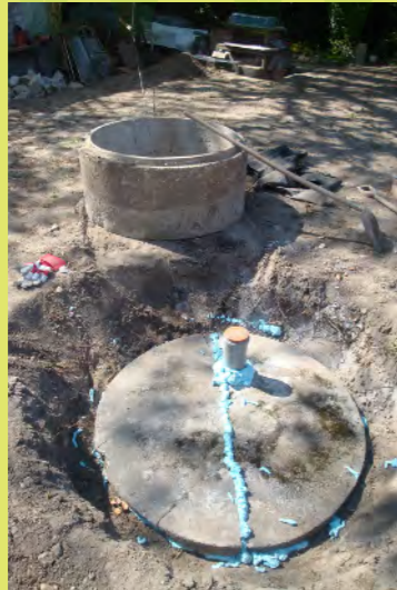
46_Nur ein kleineres Kontrollrohr bleibt