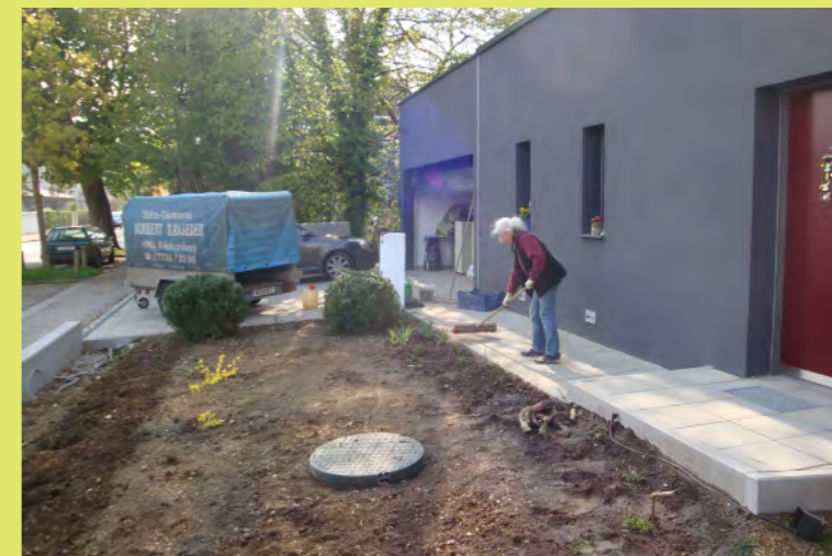
33_Jetzt wird schon sauber gemacht