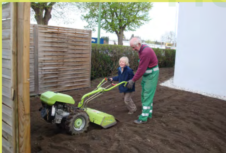
35_Da und dort muss er dann eingreifen