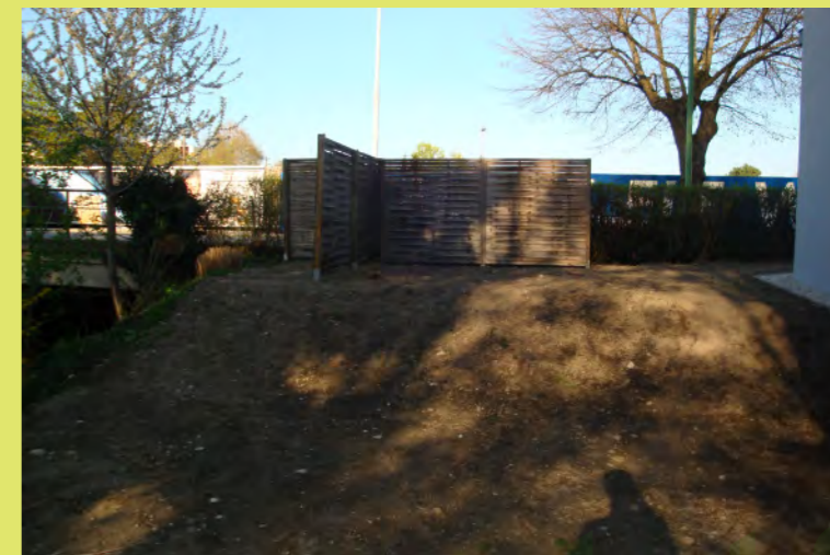
15_Nach 2 Jahren steht der Gemüsegarten wieder