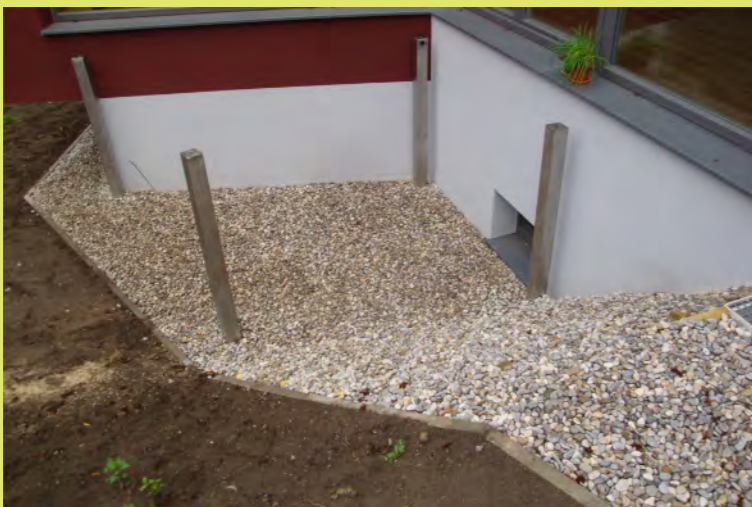
19_Frei stehend zwecks Wärmebrücken