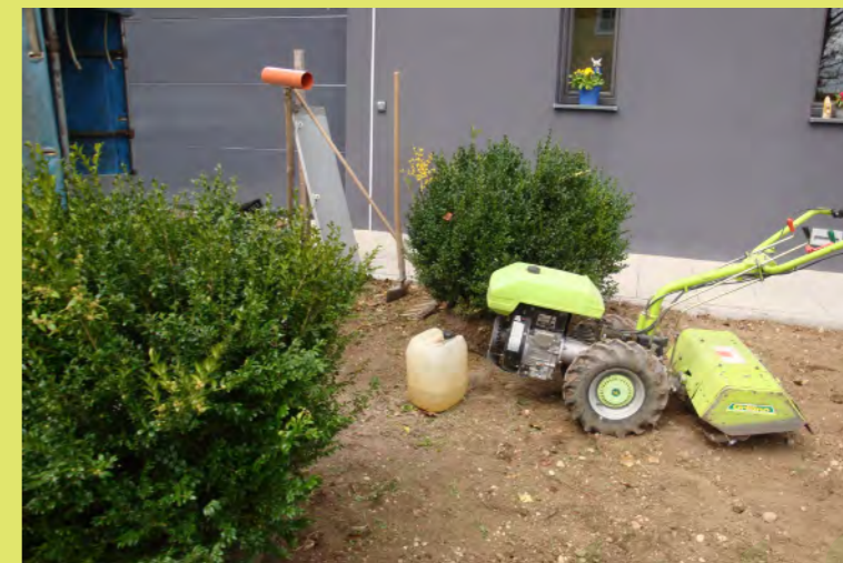
27_Berti borg uns seine Fräse