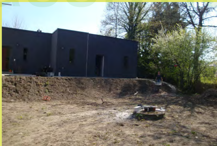
11_Ein beschwehrlicher Weg