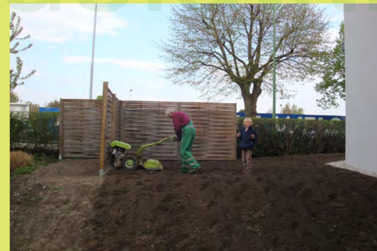
36_Dann lässt er Opa wieder fräsen