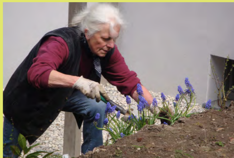
20_Blumen Oma in ihrem Element