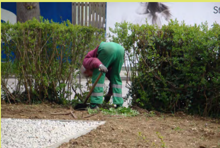
25_Blumen Opa zeigt uns seinen Allerwertesten