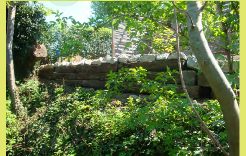
48_Die Bachböschung wird mit Bahnschwellen befest...