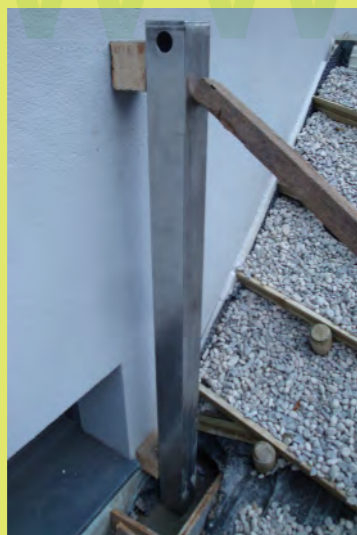
16_Die Säulen für die Wohnzimmerterasse