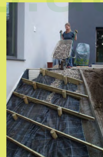
06_Dann die große Ladung von Mama