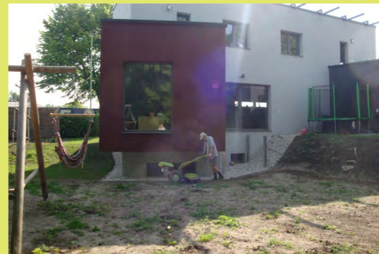
51_Dann kommt Blumen Opa wieder mit der Fräse