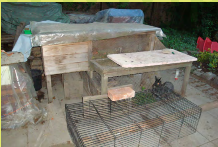
58_Unsere Hasen wurden ein bisschen umgesiedelt