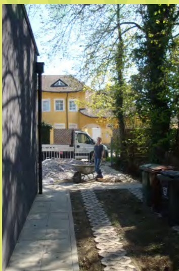
10_Der Haufen wird ja nicht kleiner