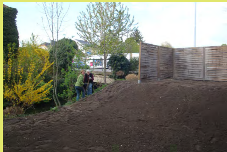
38_Oma und Pezi retten noch Blumen vor der Fräse