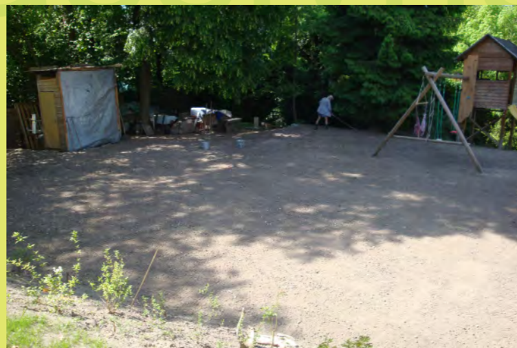
53_Opa macht mit dem Rechen den Feinschliff