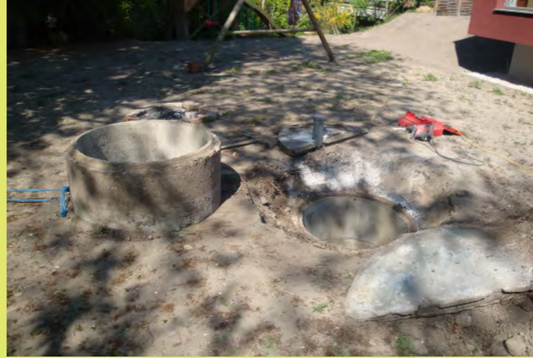
44_Mit einer Seilwinde wurde der Brunnenring entfernt