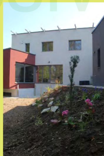
41_Die Böschung frischt den Garten besonders auf