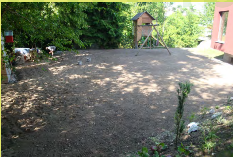
52_Langsam wird es eine grosse schöne Fläche