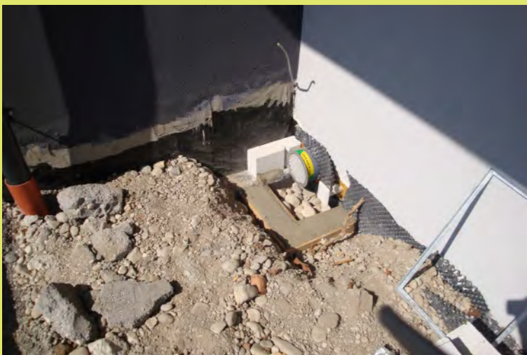
07_Das Fundament für den Abluftschacht