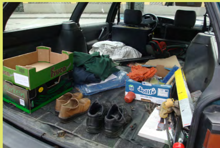
26_Und so muss ein Arbeitsauto aussehen