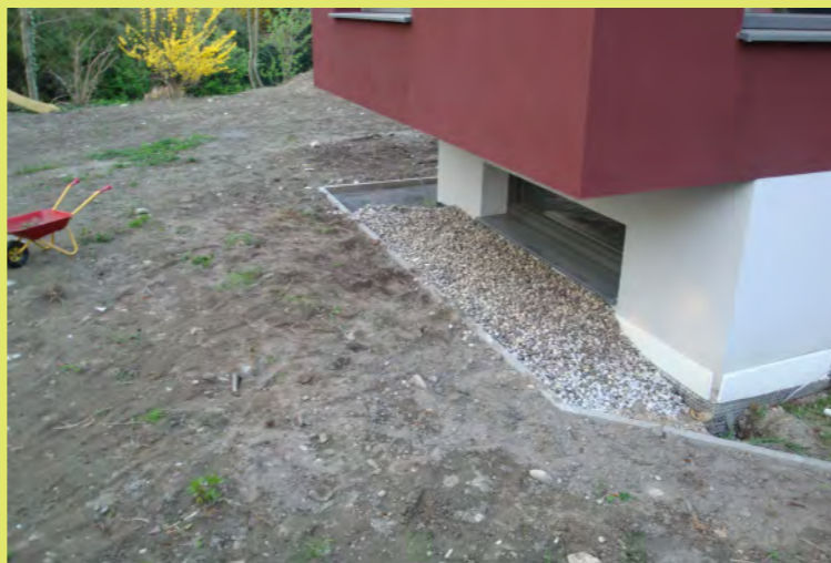
02_Da geht ganz viel Schotter rein