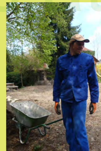
24_Blaumann sieht nach Arbeit aus