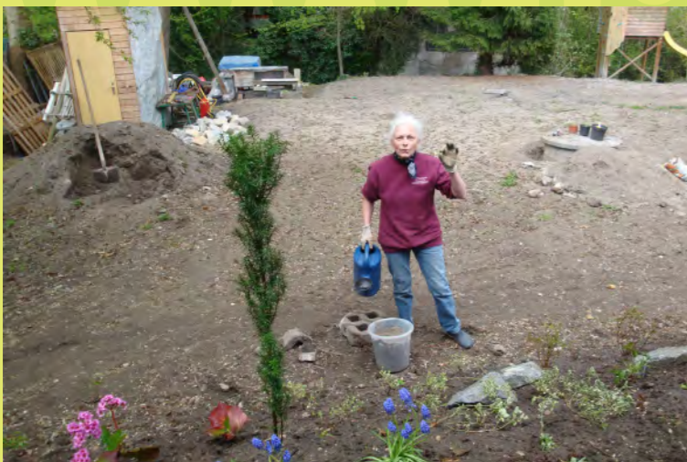
28_Blumen Oma liefert den Blumen schon Wasser