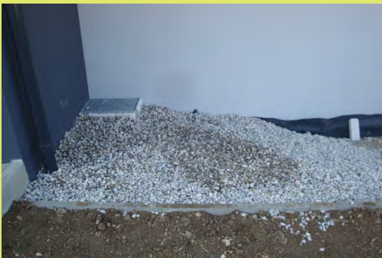
13_Die Südauskragung frisst viel Schotter