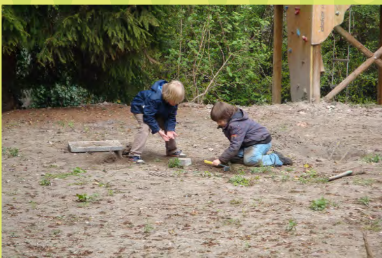
22_Elias und Niklas auf Hasensuche