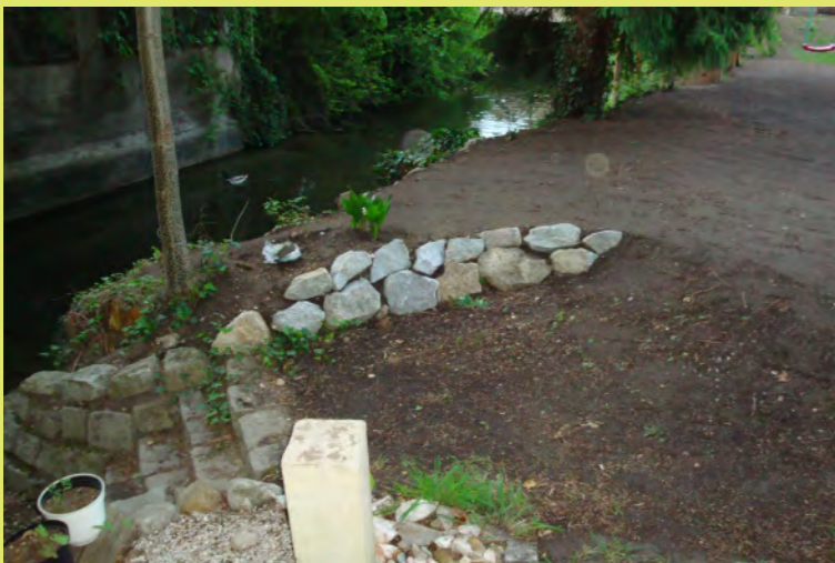
55_Auch bei unserer Lagune gestalten wir den Zugan...