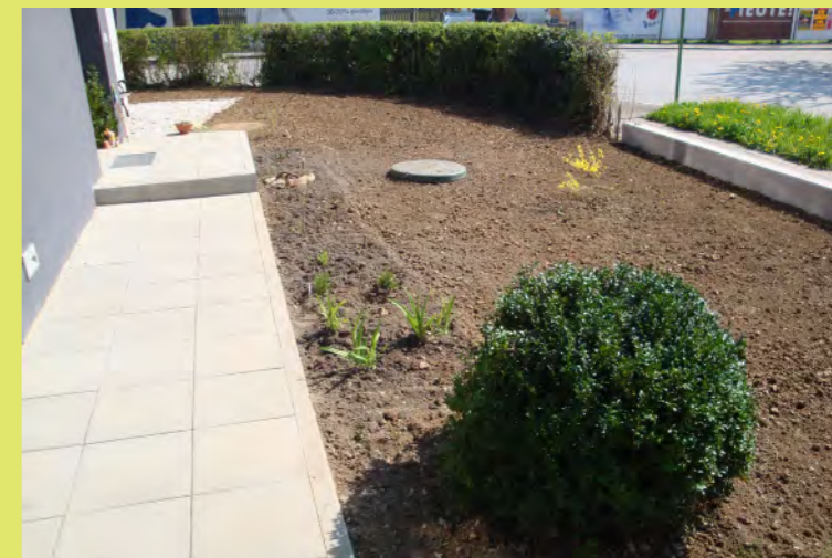
39_Teil 1 des Gartens wächst - Süd und Ost