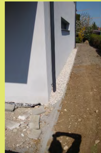
09_Die Ostseite hat auch schon Schotter