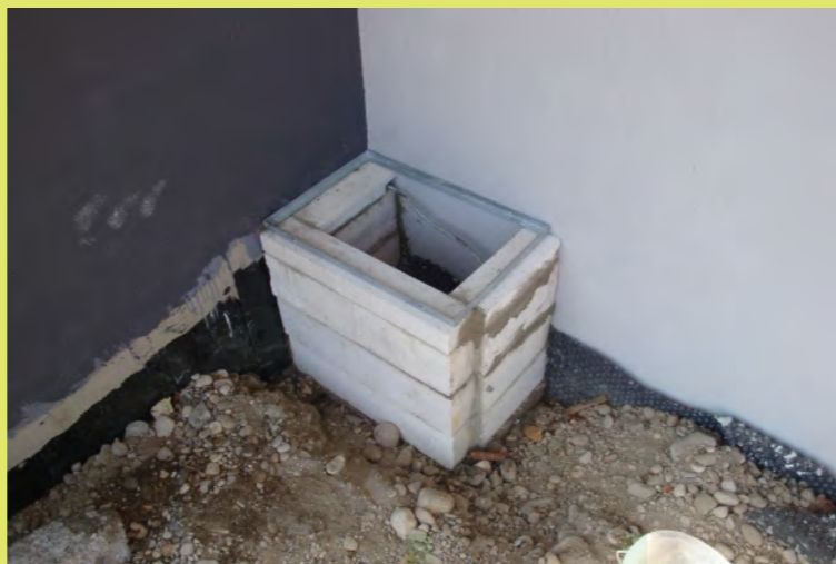
08_Der Schacht selbst wird gemauert