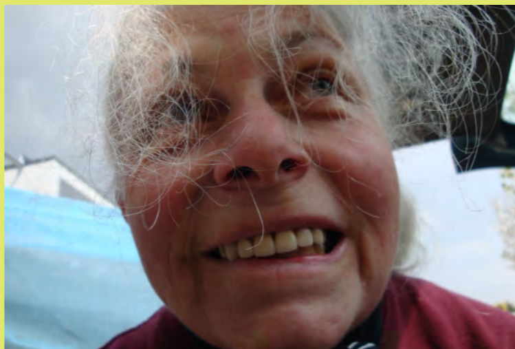
32_Blumen Oma mit Arbeitsfrisur