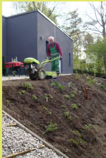
37_Auch der Streifen vor der Böschung wird grün