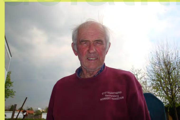
30_Blumen Opa mit Schleichwerbung