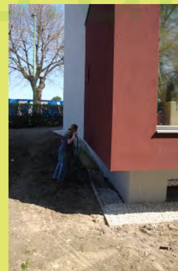
12_Bis zum Ziel