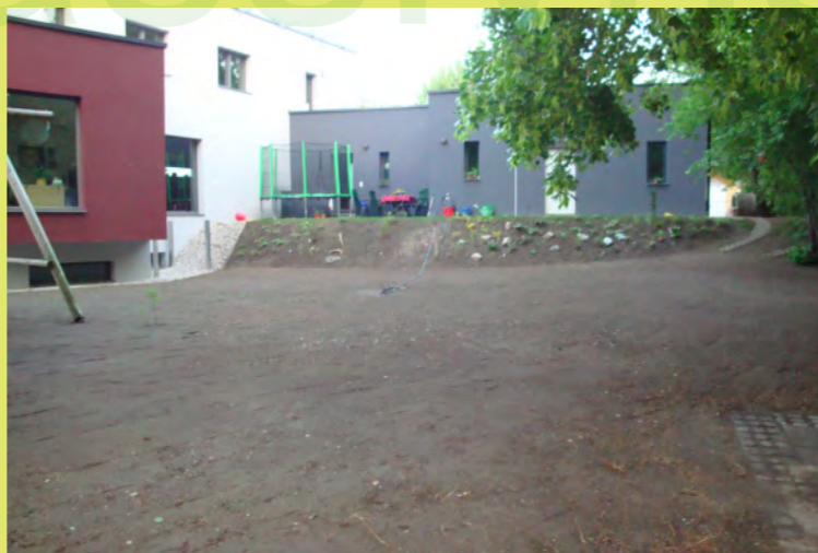
59_Das Trampo wurde auf die Terasse verbannt