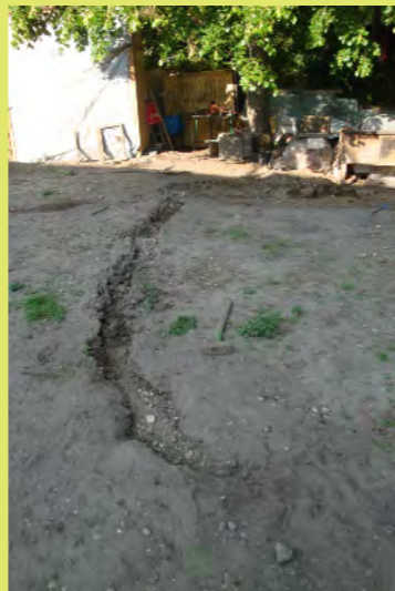
50_Nun müssen wir den Tunnel unserer Hasen zerstö...