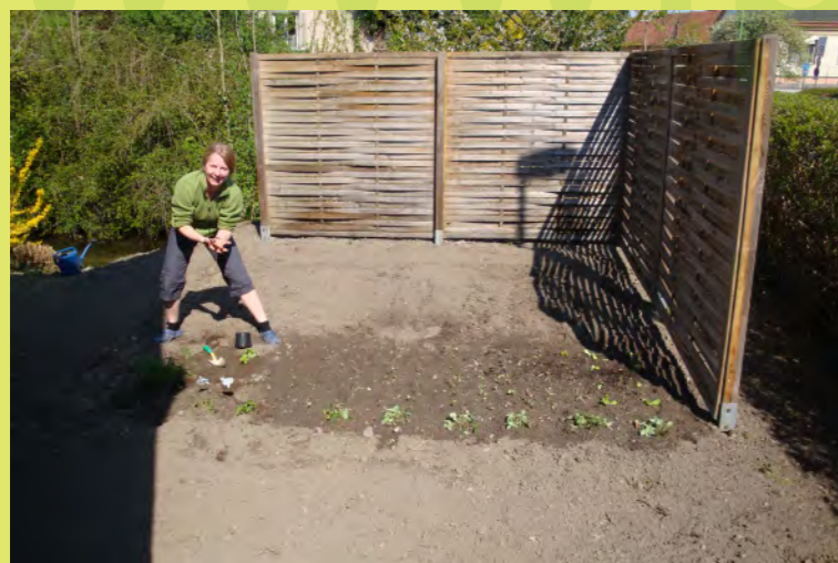
40_Pezi setzt gleich Gemüse im Garten an