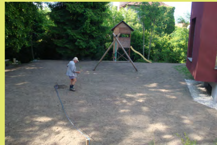
57_Dann säet Blumen Opa den Rasen Samen aus