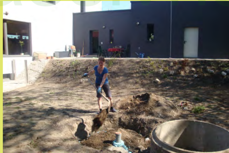
47_Pezi begräbt unseren Sickerschacht