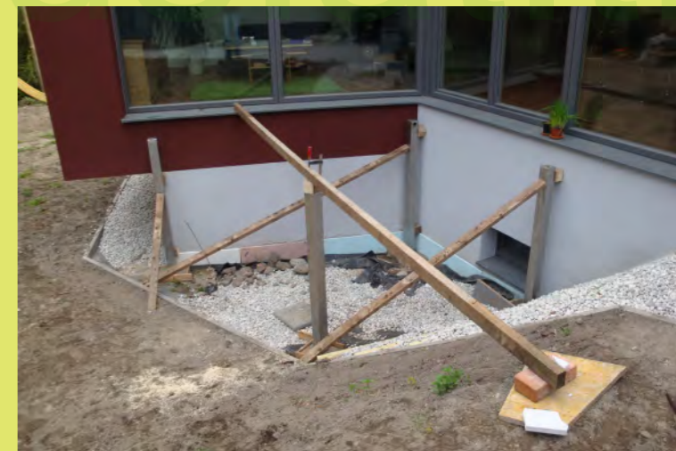
18_Alle Steher an der richtigen Position