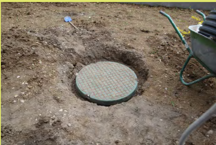
31_Der Regenwasser-Deckel muss etwas höher heraus