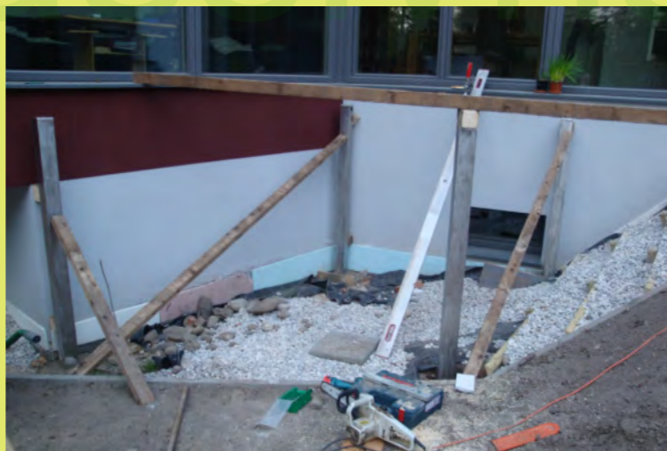
17_Mit Keilen und Spreitzen gehts schon