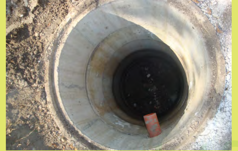
45_Der Sickerschacht wird eingegraben