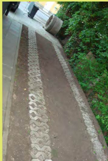
56_Die Zufahrt wird gut mit Humus befüllt