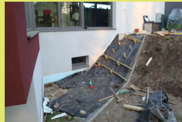
03_Die Böschung muss befestigt werden