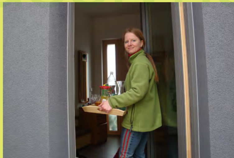
29_Und Pezi liefert uns Flüssigkeit